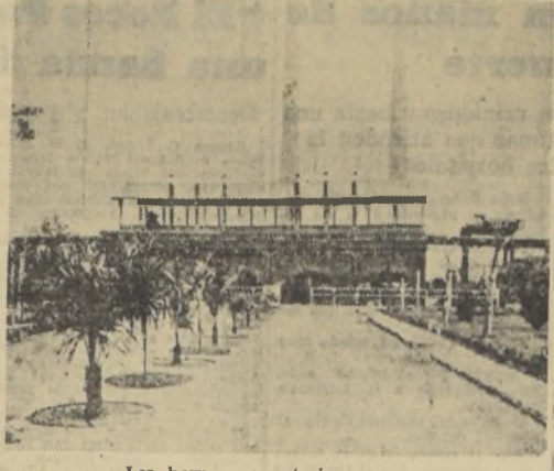
Los hornos cremat6ri6s