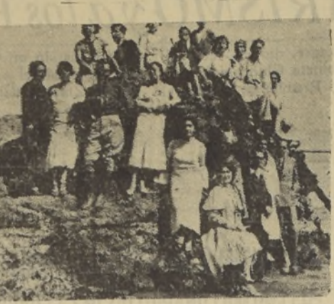
Grupo de profesores en el Campamento de Pichilemu, durante la visita del Inspector de Enseñanza Normal

PICHILEMU 22.—El campamento para la ubicación y las vacaciones de profesores de enseñanza normal, instalado en un hermoso sitio, cerca de la playa, para recibir a los profesores de enseñanza normal de esta zona.