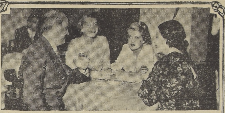
Una simpática familia argentina que veranea en Viña