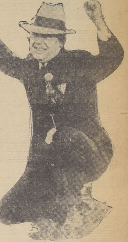
Mr. Huey Long, el "dictador" de Luisiana, contra quien estalló el complot de Baton Rouge

En los círculos de Ginebra se cree que el avance japonés ya no puede considerarse como un incidente local, y agrega: "Estos incascentes choques no podrán facilitar la conclusión de pactos de no agresión y de "buen vecino". Los que, según dicen, los mismos diplomáticos japoneses, solo pueden asegurar el restablecimiento del orden y la paz en el Extremo Oriente". Mas adelante dice que la mejoría en las relaciones ruso-japonesas importa una nueva esperanza a favor de la paz. (U. P.)