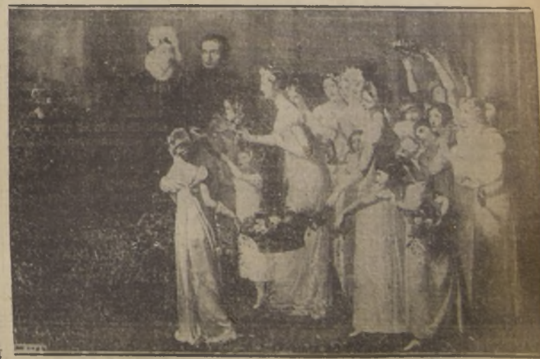
En esta ilustración se representa la suntuosa recepción que se llevó a cabo en Compiègne en honor de la Emperatriz María Luisa, a su llegada a dicha ciudad.

Hauptmann, condenado a la silla eléctrica. (Cables) La policía sigue una pista muy "delicada" en el crimen de la calle Margarita. Detalles completos de la catástrofe del Macon. (Cables) Italia podría encontrar algo inesperado si lucha con Abisinia. (Cables) Se hará el reavalúo de la propiedad en todo el país. (Crónica) Vasto plan de fomento de la producción y de construcción de obras públicas iniciará el Gobierno. "La dictación de la ley de colonización es un avance apreciable en la sub-división de las tierras", dice el Ministro Mandujano. Con una marina mercante ya poderosa, Chile puede sacar provecho de sus condiciones. NO DEJE DE EXIGIR HOY, JUNTO A SU EJEMPLAR DE NUESTRO DIARIO, EL SUPLEMENTO EN ROTOGRAFADO DE "LA NACION".