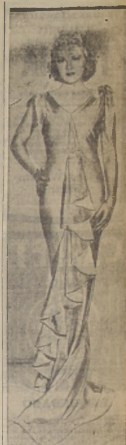
Claire Trevor, la encantadora actriz de la pantalla, usando un original traje de noche en el que predomina el azul con el oro en una bella combinación

LA MAISON GUALTIERI INVITA a sus distinguidas clientas a visitar la Exposición de Trajes Modales de Invierno, que acaba de recibir en Viña del Mar. Grand Hotel.