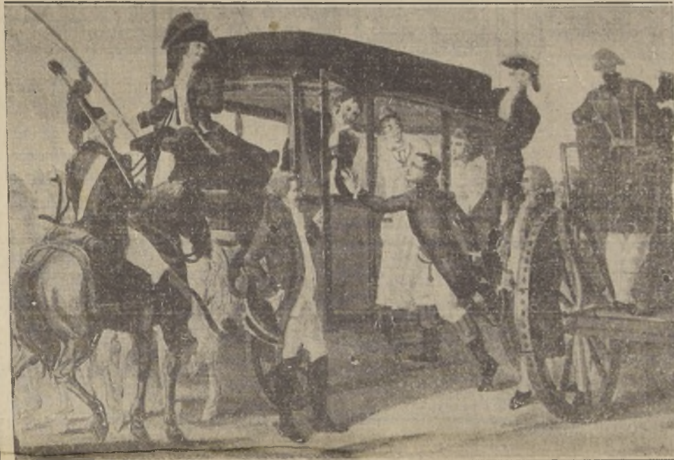
Se habían hecho los arreglos necesarios para que María Luisa, después de su casamiento por poder con Napoleón fuera recibida con gran pompa en Compiègne, Francia. Suntuosas ceremonias y festividades se habían preparado. Pero Napoleón se mostró tan impaciente por ver a su joven y bella Emperatriz, que salió adelante a alcanzarla en el camino. La encontró y conoció en su carruaje en la carretera cerca de Vitry, y desde allí la acompañó en su carruaje hasta Compiègne. La foto representa el instante en que Napoleón y María Luisa se conocieron en forma dramática en la carretera.

"Señora: Me entero de que os habéis privado de vuestra aya a fin de aparecer ante mis pueblos rodeada únicamente de francesas. Lo apruebo y estoy reconocido por lo que habéis hecho, y, sin embargo, me encuentro muy triste. Este nuevo sacrificio, unido al de vuestro padre y de vuestra familia, habrá hecho sangrar de nuevo vuestro corazón. Pero, Señora, no carguéis la culpa a vuestro esposo; no ha podido evitar esos momentos penosos que dependen de la na-