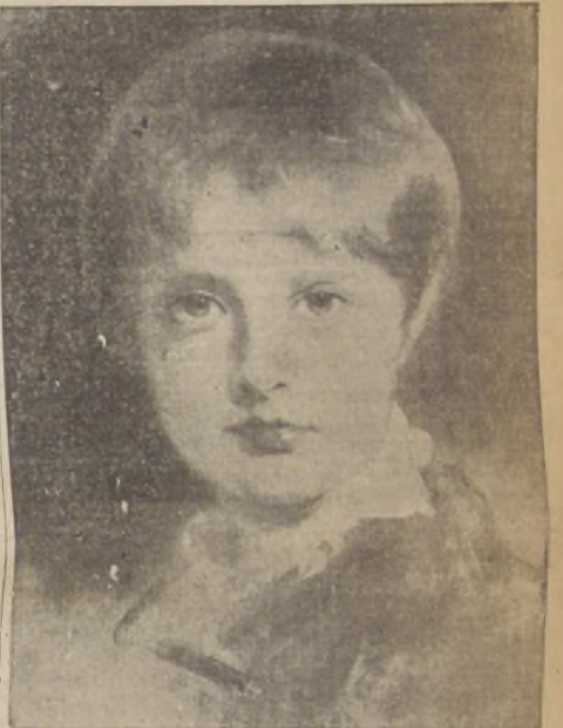
El Aguilucho, el hijo de Napoleón y "Rey de Roma"

Napoleón se ha presentado a la Emperatriz en el palacio de Compiègne. Evocando la ceremonia de Nuestra Señora, ha colocado la corona en la cabeza de Josefina, arrodillada ante él. Decidió el ceremonial en el curso de su primera entrevista con María Luisa. Sus Majestades se encontrarán a dos leguas de Solsons, donde se ha erigido una tienda. La Emperatriz se inclinará, si bien, antes de que llegue a ponerse de rodillas, el Emperador se levantará. Pero su impaciencia y también la lluvia lo disponen de modo distinto. El Emperador, que salió precipitadamente en calesa el 27 de marzo, con el Rey de Nápoles, Murat, encontró a las cinco de la tarde en Courcelles a la hija del Emperador Francisco. "Señora—dijo, besándole la mano—, mi placer es grandísimo al veros". Y subiendo a la carroza, emprendió con ella el camino de Compiègne, a donde llegaron a las diez de la noche. El matrimonio civil fué celebrado en St. Cloud el día 1.º de abril. Al día siguiente, el Emperador y la Emperatriz efectuaban su entrada solemne en París, pasando bajo el Arco de Triunfo, que no estaba todavía terminado. Un sol radiante iluminaba el mágico espectáculo del cortejo que avanzaba, a través de inmensa muchedumbre, hacia el palacio de las Tullerías.