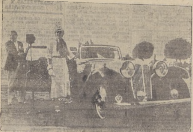
Señorita Bebé Larrain