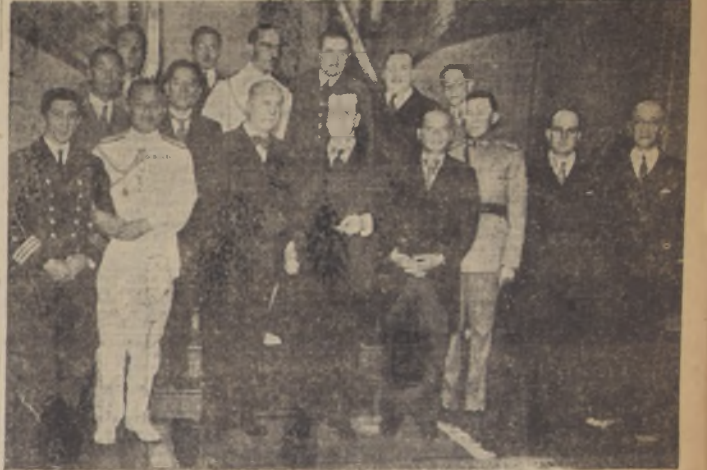
Asistentes al almuerzo ofrecido ayer por el Ministro del Japon