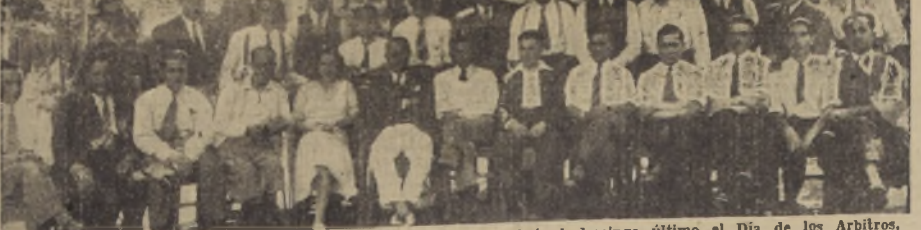
Asistente a la manifestación con que la Asociación Santiago celebró el domingo último el Día de los Árbitros, en la Quinta Errazo, de Peñalón.