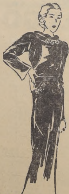
Pauline Sainte-Anne emplea para este traje una originalísima tela de marroquin lustrado que hace visos diferentes de mucho efecto. Este traje, aunque es de tarde, bien puede llevarse también para comidas y reuniones de noche, por ser una tela muy apropiada.