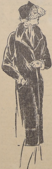
Un abrigo de raso, de corte de sport muy elegante, y que es el último grito de la moda para llevar con trajes de tarde. Lleva solapa volteada y anchos bolsillos. Creación de Viesot.

Anuncia que para almorzar en la playa se puede usar un precioso "robe de chambre" de seda azul a lunares. Una falda de tejido de lana, como el que se usa para las velas de los yates, abotona adelante sobre un traje de baño, muy breve, tejido a mano en un fresco verde.