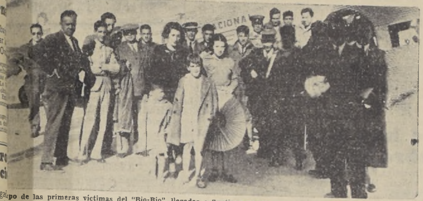
ajo un avión de la Línea Aérea Nacional, que aterrizó en la tarde en Los Cerrillos.— Perdieron sus equipajes en el naufragio

de los aviones de la Línea Aérea Nacional que se estrelló en los Cerrillos algunos días antes del incendio de la "Industria", ocurrido recientemente en el mismo establecimiento.