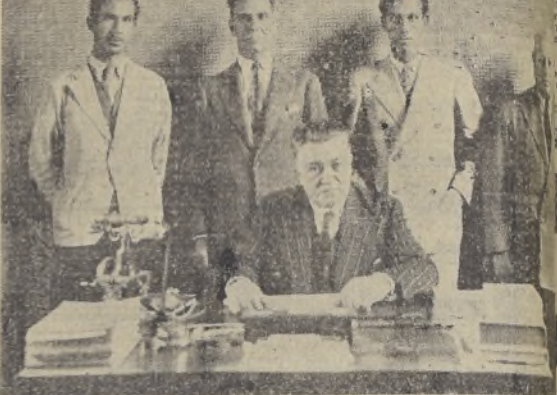
El alcalde de Machali y personal de la Municipalidad a la luz alegre del sol.

toridades y habitantes del pueblo. Presenta un hermoso golpe de vista, a la entrada de Machali, y es como una invitación a la vida alegre, al paseo alegre y sano, bajo