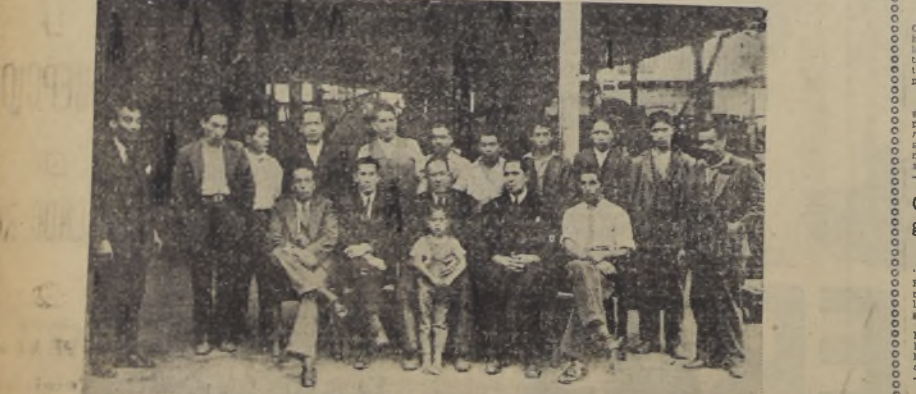
Circuito Rancagua organiza el Club Ciclista Flecha

— D E — PEDRO P. JEREZ TROPEZON 1185 — TELF. 123 — CABILLA 29 — RANCAGUA Se compone toda clase de maquinarias agrícolas: Trilladoras, Motores, Prensas para pasto, etc. ESPECIALIDAD EN REPUESTOS DE ARADOS Y ANEXOS PARA TRILLAR POROTOS SE HACE TODA CLASE DE SOLDADURA AL OXIGENO Establecida el año 1913. Chilenos, 14 operarios. Establecimiento montado con toda clase de maquinarias modernas relacionadas con el ramo. Cuenta corriente en el Banco Chile