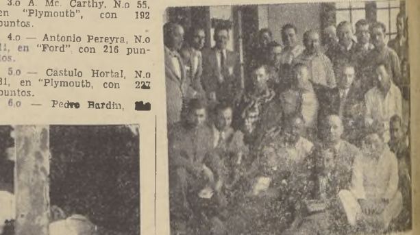
Los pilotos acompañados de los jefes de etapa de Temuco

ayer por el Automóvil Club Argentino, en uso de las facultades que le otorga el inciso 4 del Art. 21 del Reglamento, que dice: "Neuquén, la prueba en aquellas zonas que, por dificultades para su paso así lo requieran", la partida se dará, a las 6 horas de hoy, desde el punto denominado Cipolletti, lo que significa disminuir el recorrido de la etapa en 72 kilómetros. En consecuencia, el total de la etapa de hoy, comprende 592 kilómetros, subdivididos así: De Cipolletti a General Roca, 47 kilómetros. De General Roca, Chichinales, 53 kilómetros. De Chichinales o Choele-Choele, 127 kilómetros.