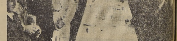
Durante el vermouth de honor ofrecido a los pilotos en el Club Temuco, el

Vertical text on the right edge of the page, including various small notices and advertisements.