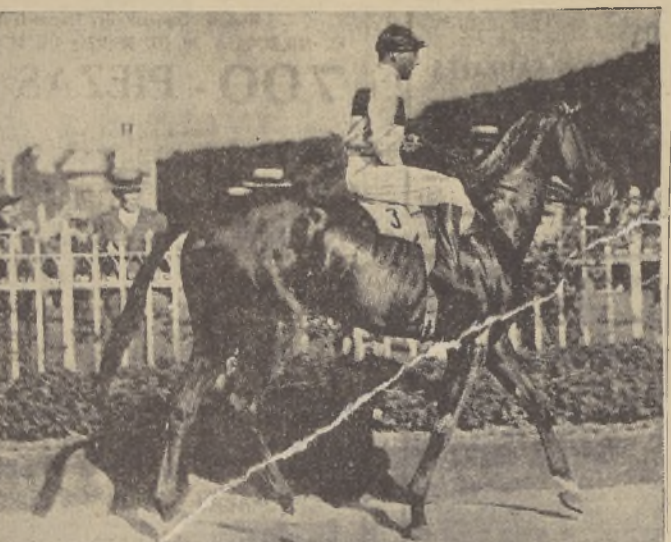
CHOCO, por Mi "Amigo y Clonavarr, que se ha consagrado en Palermo como el mejor "dos años", al adjudicarse el galope el clásico G. Kemmis, disputado el Dgo. último