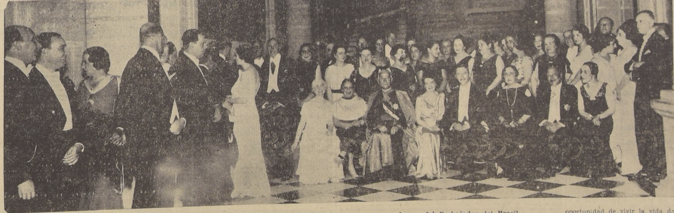
Una parte de los asistentes al banquete de anoche en honor del Embajador del Brasil