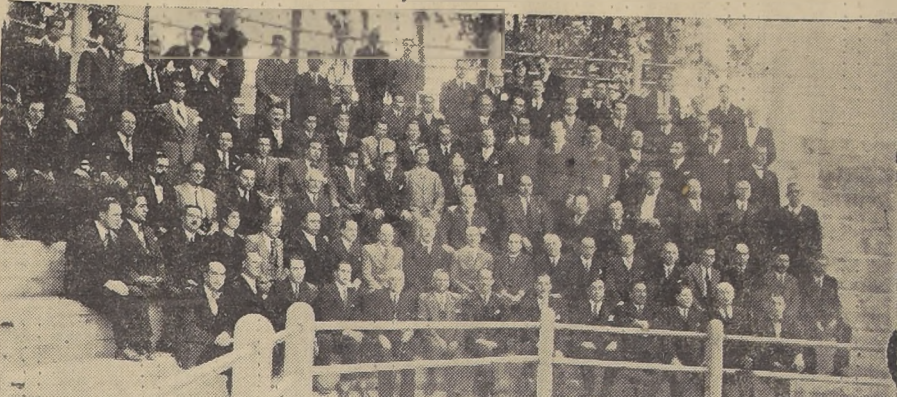
Asistentes a la manifestación al Alcalde de Lima