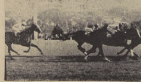
Ripley aventaja a Estadista, Marco Tulio y Sirenia.

La inscripción está abierta en la Sección Construcción del Departamento de Caminos hasta el 6 de Abril próximo. Santiago, a 26 de Marzo de 1935. EL DIRECTOR DEL DEPARTAMENTO DE CAMINOS. Prop. 6 A.