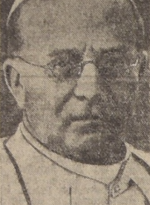
S. S. Pio XI