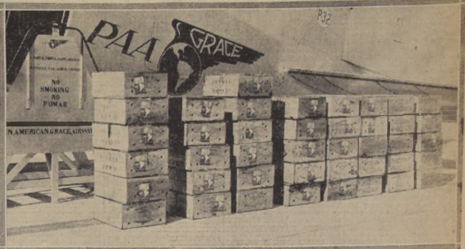
En un avión especial de la Panagra, fueron conducidos ayer hasta Mendoza 42 cajones, que contenían langostas vivas consignadas a Buenos Aires. Este importante embarque acusó un peso de 1.176 kilos

Además ha llegado a Santiago, en misión de propaganda, el periodista boliviano, don Augusto Céspedes. El señor Céspedes viene acompañado de su esposa.