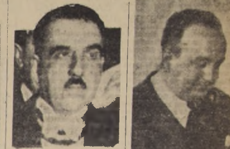
El Embajador Cariola

Especially se abordarán durante sus sesiones cuestiones de intercambio de productos y de aduanas.