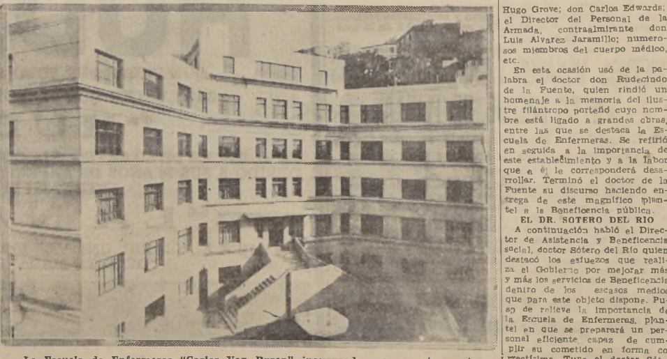
La Escuela de Enfermeras "Carlos Van Buren", inaugurada ayer en este puerto.