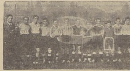
En la mañana de ayer, en el Estadio El Llano compitieron en football los elencos de las oficinas de Valparaíso y Santiago, triunfando estos últimos por 3 a 2