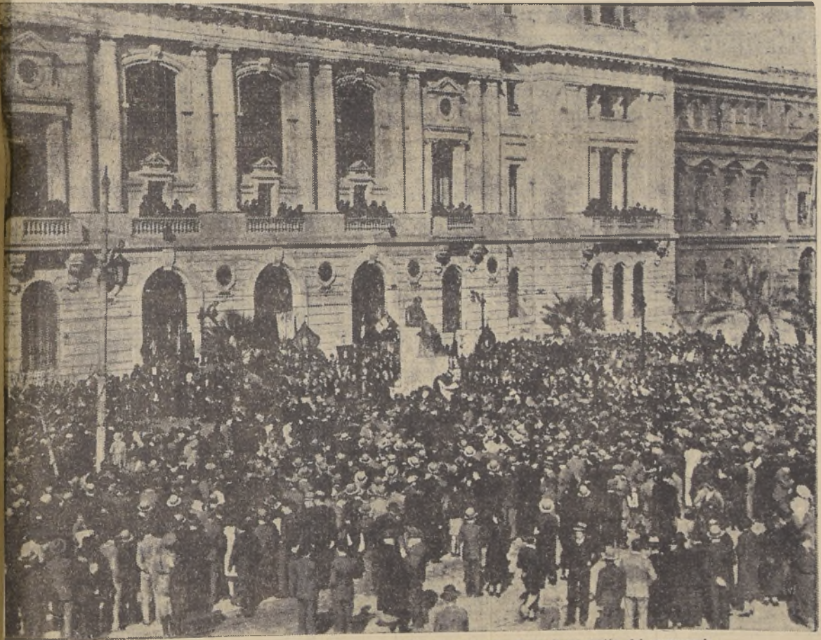
Vista parcial de la enorme concurrencia que asistió a la solemne ceremonia de la inauguración del monumento.

Desde mañana "La Nación" publicará, en forma exclusiva, la versión completa y oficial de las sesiones del Senado y de la Cámara de Diputados.