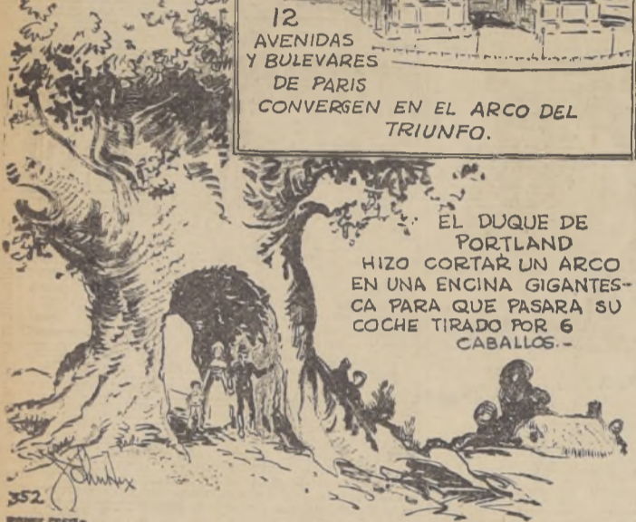
EL DUQUE DE PORTLAND HIZO CORTAR UN ARCO EN UNA ENGINA GIGANTESCA PARA QUE PASARA SU COCHE TIRADO POR 6 CABALLOS.