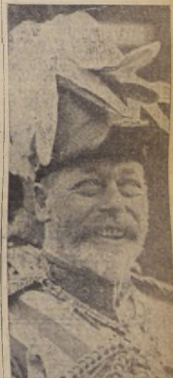
Jorge V de Inglaterra, el septuagésimo aniversario de cuyo nacimiento se celebra hoy