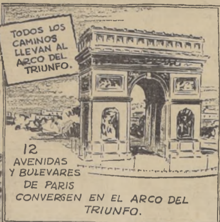
12 AVENIDAS Y BULEVARES DE PARIS CONVERGEN EN EL ARCO DEL TRIUNFO.

JIMMY ARCHER de los "Cubs" de Chicago SE HIZO BEISBOLISTA DEBIDO A UN ACCIDENTE QUE LE DEBILITO EL BRAZO IZQUIERDO.