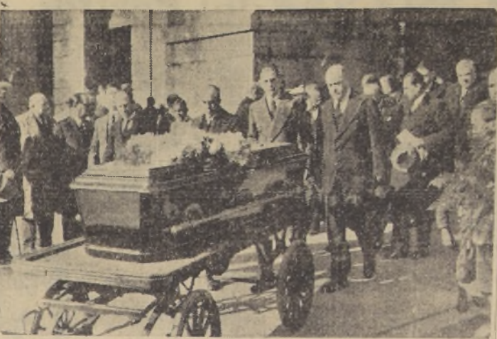
Los restos mortales de don Javier Vial Solar son conducidos al Mausoleo de la familia

Concurrió lo más destacado de nuestro mundo social, político, diplomático e intelectual