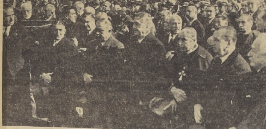
Ministros de Estado, altos dignatarios de la Iglesia, miembros del Poder Judicial y otras autoridades, durante la ceremonia