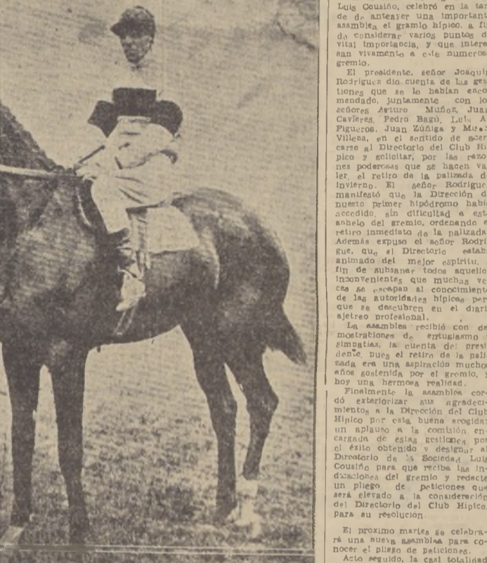
WINDSOR LAD, notable hijo de Blandford, ganador del Derby y Saint Leger del año pasado, acaba de triunfar en forma holgada en la Coronation Cup...