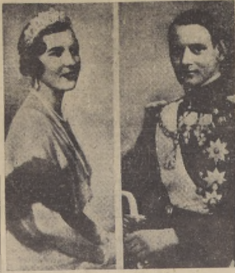
La princesa Ingrid, de Suecia, y el Príncipe Federico, heredero del Trono de Dinamarca, que se casaron el 28 de mayo en Estocolmo

Parece que las Casas Reales tienen otra vez un porvenir en Europa, dijo alguien de seguro que si hay algunas que no tendrán que pasar a través "de dolores" son estas Casas escandinavas, amadas y respetadas de sus pueblos y que han mostrado una comprensión realmente genial de la hora que viven las naciones.