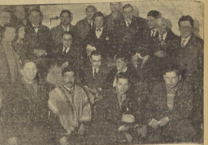
Miembros del Comité Pro Manifestación a S. E. y Ministro de Relaciones Exteriores