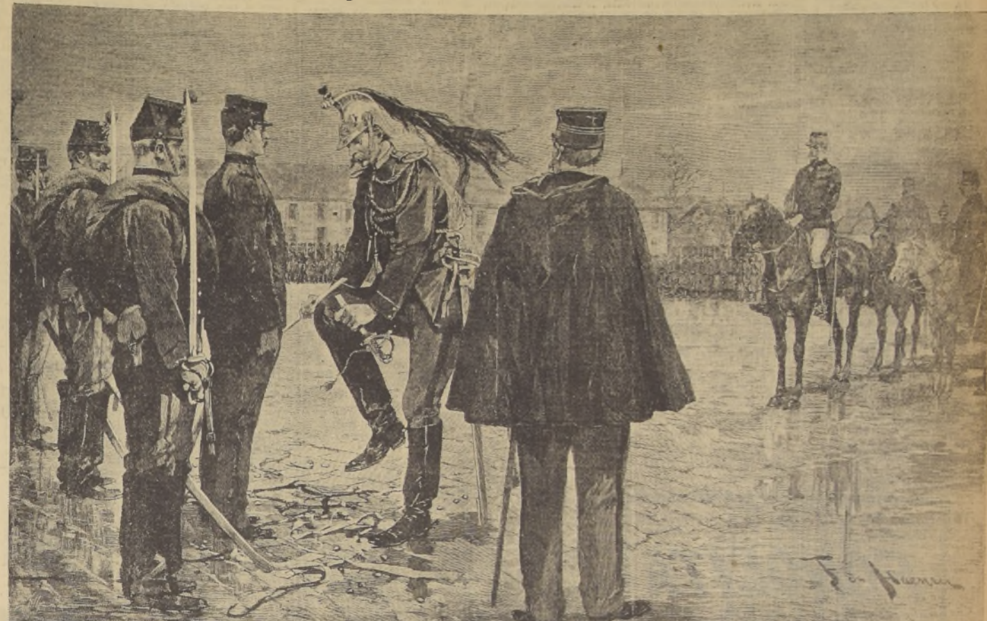
El comandante de Dragones rompe la espada del condenado en el patio del Cuartel de los Inválidos

Entretanto, el Gobierno de Meinelimita y va al Gobierno M. Brisson de las Izquierdas. Sin embargo, éste nombra Ministro de la Guerra al general Cavaignac, nacionalista y antisemita. Jaurés alude en el Congreso al documento en que se nombra a Dreyfus con todas sus letras, presentado por el capitán Henry, y a esto responde Cavaignac ordenando a un periodista, Cugniet, que examine el famoso bordereau una vez más. El 13 de agosto de 1898, por la noche, Cugniet nota por primera vez que el documento, parchado como está, consta de dos trozos escritos en papel diferente, uno en tinte violeta, el otro de un gris azulado. El 30, el Ministro interroga a Henry, perso-