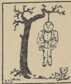
E OPTIMISTA.—Todavía no pierdo la esperanza; la cuerda puede romperse.. OOOOOOOOOOOOOOOOOOOOOOO