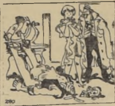
DRAMA PASIONAL. — Doctor... Doctor... Sávelo por Dios; yo lo amo todavía. (Le Rire, París). OOOOOOOOOOOOOOOOOOOOOOO