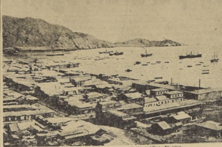
Taltal, puerto en el cual se ha descubierto tráfico de opio

TALTAL, 12. — La prensa de esta ciudad, en grandes cantidades, el tráfico de opio y otros estupefacientes que ha sido descubierto recientemente.