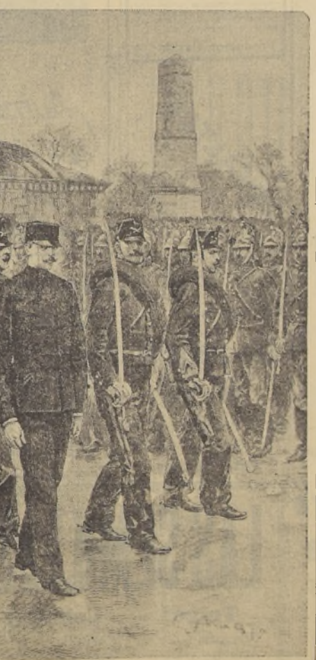
El ex capitán Dreyfus marcha al sitio de la degradación

Después de la guerra, se retiró a la vida privada practicando "el arte de ser abuelo", como escribía a sus amigos, hasta a menudo a Clemenceau con quien era sumamente amigo. Se entiende que escribió sus memorias con la condición de que no fueran publicadas durante su vida. En su hogar de París, cerca del parque Monceau vivía rodeado de sus nietos, hijos de su hija e hijo. El último disturbio de su tranquila rutina fue en junio de 1908 durante la ceremonia del traslado de las cenizas de Zola al Panteón, cuando un periodista disparó dos tiros a Dreyfus hiriéndolo en el antebrazo.