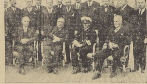
Asesna a bordo del almuerzo a bordo del "Osnabrueck"