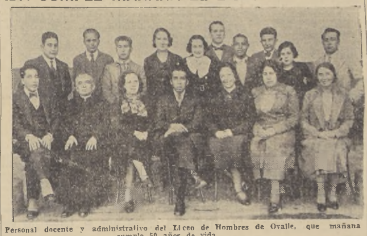
Personal docente y administrativo del Liceo de Hombres de Ovalle, que mañana cumple 50 años de vida.