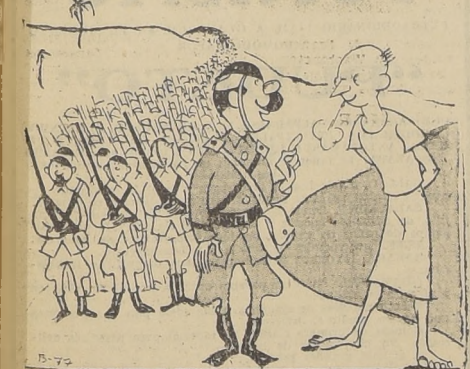
(De "El Romancero de Fipo")