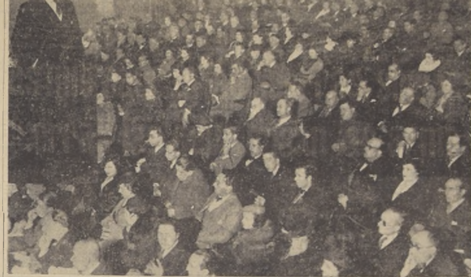
Asistentes a la conferencia del Embajador señor de Madariaga, en el Teatro Municipal