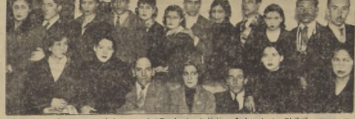
Jóvenes y señoritas que integran el "Conjunto Artístico Laboratorio Chile", nuevo y estudioso grupo de cultores del arte que se presentará en el Teatro de la Escuela J. A. Nuñez, Delicias 3677, con un sobresaliente programa