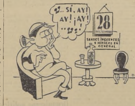
28 años de existencia de la revista familiar

Señor dueño de Ford V-8 Rogamos a nuestros clientes pasen por nuestra Estación de Servicio, calle Gálvez 171, donde gustosamente le normalizaremos el encendido de su coche, adelantándolo algunos puntos, para así obtener el máximo de su rendimiento con el nuevo combustible "ESSO" que ha llegado a Chile.