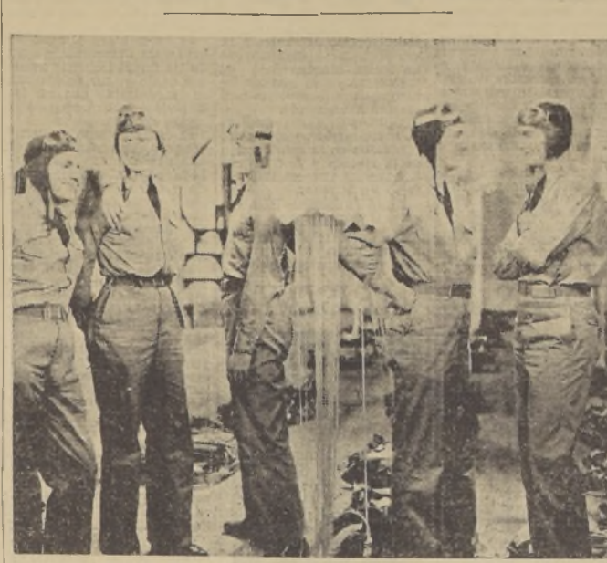
Grupos de expertos pilotos militares, del Ejército de los EE. UU. ejecutan maravillosas proezas en este gran film