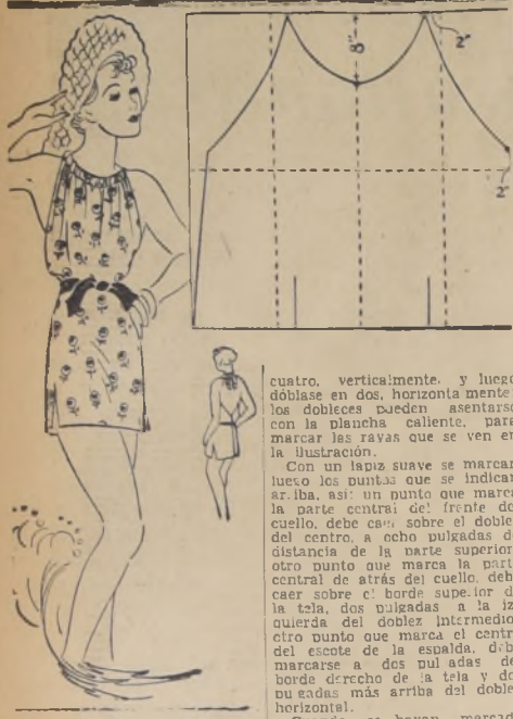
UN TRAJE DE BASO COMO-DO Y ORIGINAL

Si a usted no le queda bien la ropa de baño estrecha y horrida al cuerpo, si tiene predilección por líneas sueltas y más suaves que las de los trajes de baño comunes, le ofrecemos aquí un pequeño modelo de playa que indudablemente le gustará. Este modelo, hecho de tela gabiam, es muy sencillo y cómodo. He aquí cómo se corta. Corte una pieza de tela que sea dos pulgadas más ancha que la dimensión de su cintura y que sea dos pulgadas más larga que la longitud que hay entre la base del cuello y la parte de la pierna hasta donde usted desea que termine el traje. Dóblese el modelo de tela en