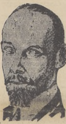
Sir Hubert Wilkins