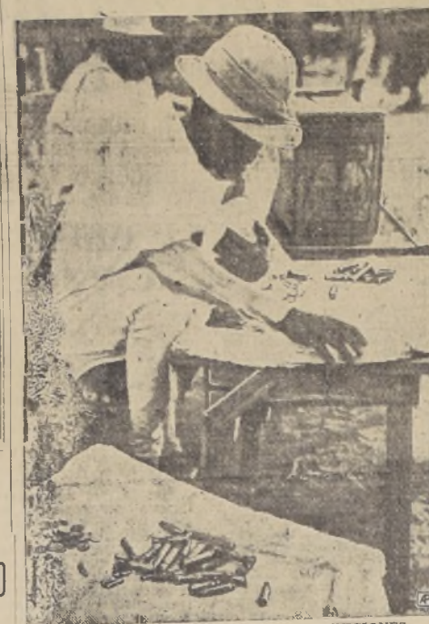
LAS CALLES SON MERCADOS DE MUNICIONES