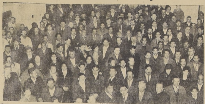
Los comerciantes en subsistencias de la Vega Central y de diversos Mercados Municipales en el hall de LA NACION