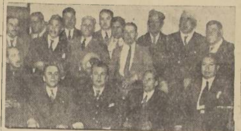
Parte de los delegados asistentes a la concentración efectuada por el Sindicato de Peluqueros...