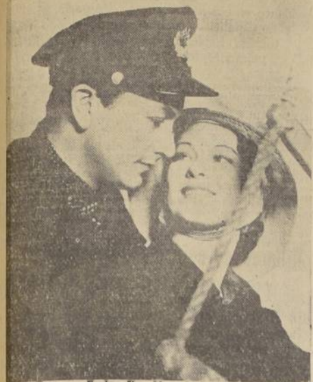
Robert Young y Evelyn Venable principales intérpretes de "Corazones extraviados" en una escena de esta película, que se estrenará hoy en el Splendid

En las funciones de tarde y noche de hoy, estrenará el Teatro Splendid, una gran producción Metro-Goldwyn-Mayer, titulada "Corazones extraviados". Esta obra, modelo de gracia y elegancia, ha sido estrenada en los países del habla inglesa, bajo el título de "Vagabond Land" y en Francia con el nombre de "Una mujer a bordo", constituyendo en todas partes uno de los más grandes éxitos cómicos del año 1935.