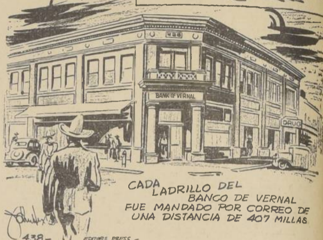
CADA LADRILLO DEL BANCO DE VERNAL FUE MANDADO POR CORREO DE UNA DISTANCIA DE 407 MILLAS