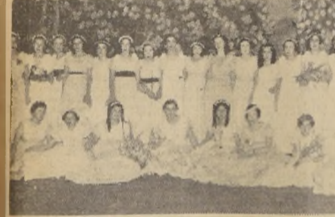
Distinguidas señoritas que tomaron parte en la función de ayer en el Teatro Municipal, a beneficio de los Centros Obreros de Instrucción