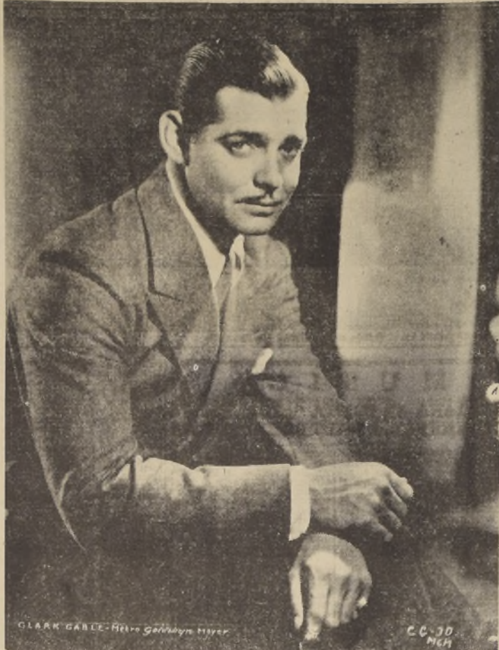
La última fotografía de Clark Gable, el famoso actor de cine que llegará a Santiago el próximo lunes.