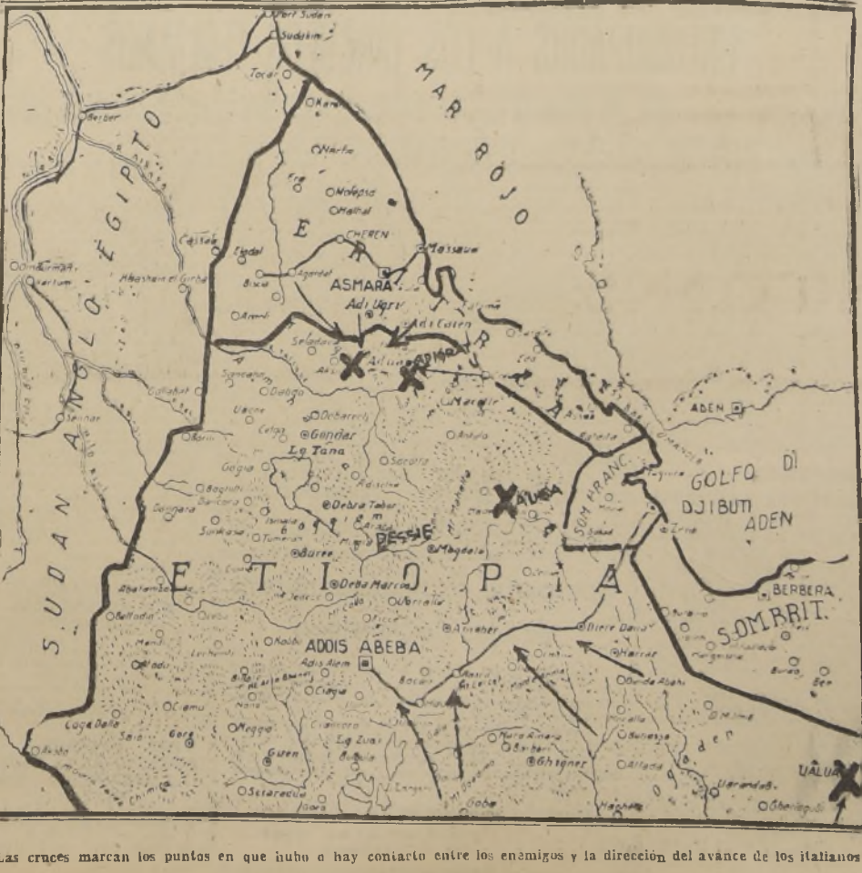
Las cruces marcan los puntos en que hubo o hay contacto entre los enemigos y la dirección del avance de los italianos

BERLIN. 3. (Transocean).— "Italia", dice el diario "Berliner Tageblatt" en su editorial de esta noche, en que comenta el problema jurídico planteado por Mussolini, "ha tenido suficiente tiempo para preparar en todos sus detalles el peso decisivo que ha comenzado a dar ahora con el ataque pánico contra dos ciudades abisinias y con sus operaciones militares en Amadú, no esclarecidas aun. Este ataque presagia una voluntad guerrera irresistible..."