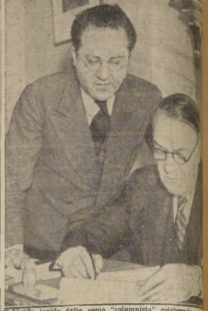
Habiendo tenido éxito como "columnista" colaborador de los diarios, se ve aquí al general Hugh S. Johnson...