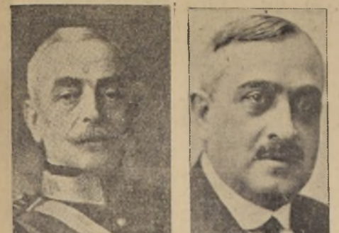
Excmo. señor Antonio Oscar Carmona, Presidente de Portugal.