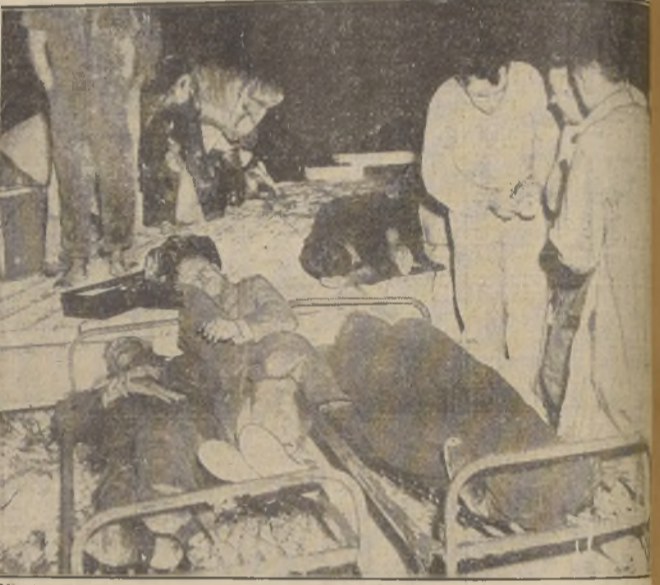
Mientras que los muertos y heridos entre los veteranos de la guerra mundial subieron a cientos...