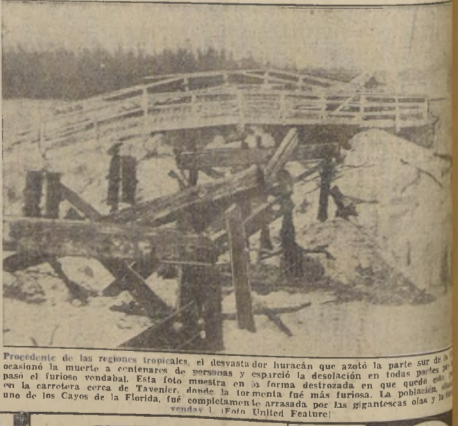
Procedente de las regiones tropicales, el devastador huracán que azoló la parte sur de la Florida...