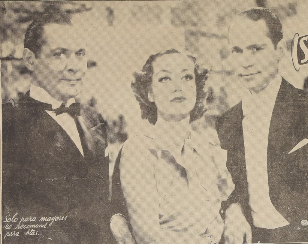
Solo para mayores he recomendado para ellas.

Cuando ya había terminado de su misión, nos dijo como disculpándose de su falta de energía: —¿Cómo le va a pegar uno a estas guaguitas...!