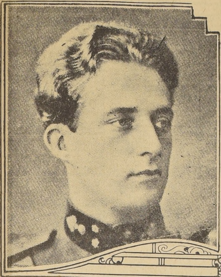
S. M. Leopoldo III, Rey de Bélgica, cuyo onomástico celebra hoy todo su pueblo

Muy pronto, señora, PODRA ASISTIR A UN GRAN ACONTECIMIENTO: LA PRESENTACION DE ROSE MARIE