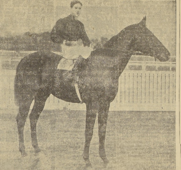
TAPICERO, por Último Día y La Tapera, conceptuado como el mejor "tres años", y que el domingo próximo reaparecerá en el clásico "La Huasca", enfrentando lo mejor que hay en su generación, excepción de Rokof, ausente obligado por las condiciones de la carrera.

En Adam Dux, Bamboleo, Gerardo, Palais Royal, Quemadura y Taxi Girl lleva enemigos peligrosos. — El clásico "La Huasca", es el verdadero "Ensayo" de 1935