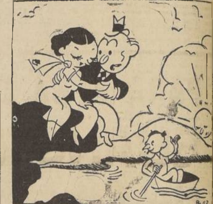
Todo tiene arreglo... (De 'El Romancero de Miro')