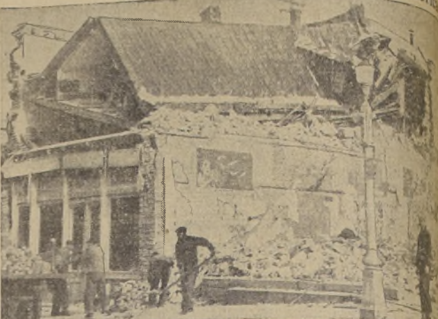
En medio de un frío intenso, los residentes de Helena, Estado de Montana, se han visto obligados a limpiar las calles de los escombros dejados por más de 700 temblores ocurridos durante las últimas semanas.

Trigo: diciembre, 0.95; mayo, 0.95. Maíz: diciembre, 0.5812; mayo, 0.5887.