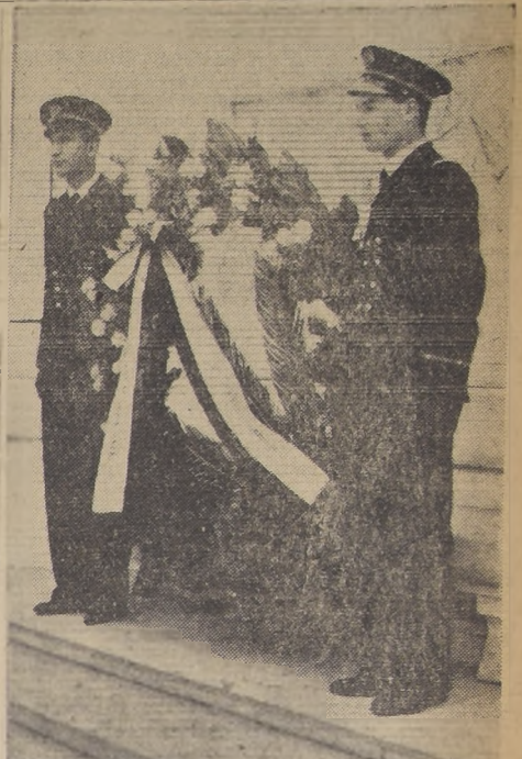
Dos oficiales del crucero francés colocan en el Monumento a los Héroes de Iquique la hermosa corona