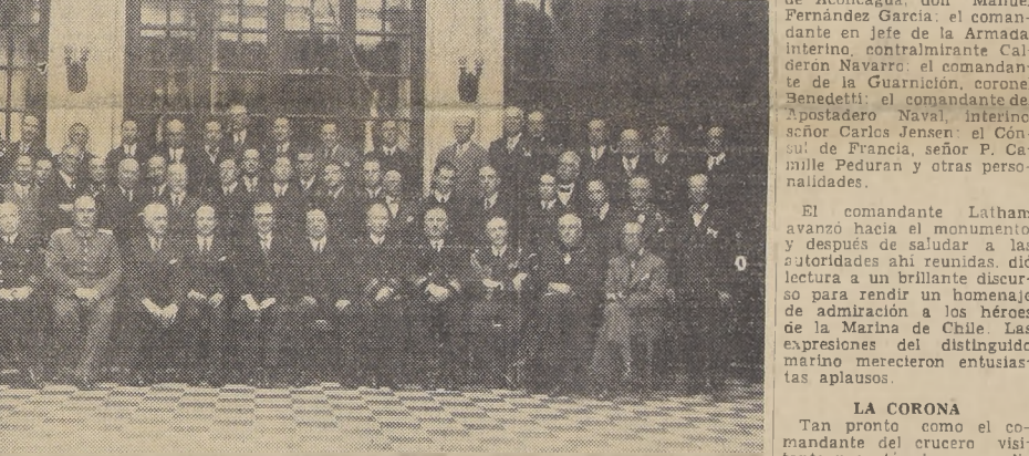
Asistentes al almuerzo ofrecido por la colectividad francesa de Valparaíso al comandante, jefes y oficiales del "Jeanne D'Arc"