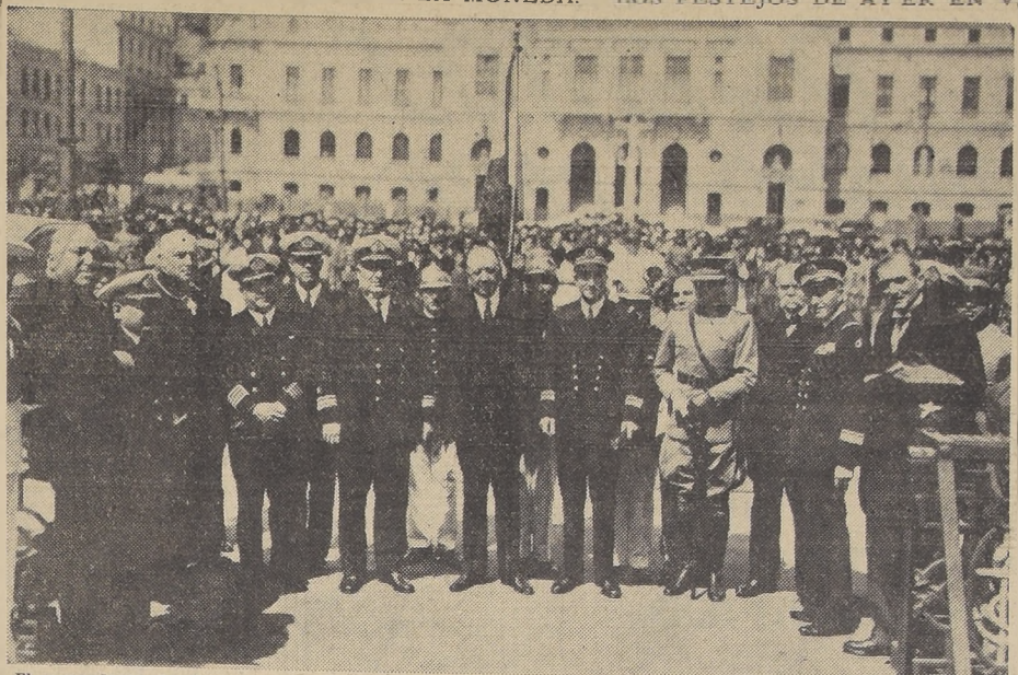
El comandante del buque escuela "Jeanne D'Arc", señor Latham, rodeado del Intendente de Aconcagua, del Director General de la Armada, interino, del comandante de la Guarnicion y demás autoridades porteñas al pie del monumento a Prat en el momento de realizarse la significativa ceremonia.

Hoy a las 11 horas llegará a la Estación Mapocho el Comandante Mayor y oficiales del buque escuela "Jeanne D'Arc", que se encuentra en Valparaíso a cargo de la comandancia del comandante de la capitán de navío M. P. Latham. CON S. E. Mediatamente de llegar al capital, el comandante Latham, Estado Mayor y oficiales serán recibidos por S. E. el Presidente de la República en el Salón de Honor de la Moneda, a donde acompañarán sus Ministros de Estado y Educacion. A las 13 horas el señor Ministro de Francia, Excmo. Sr. de Sartiges les ofrecerá un almuerzo en la Leona. A las 23 horas asistirán a un baile en la misma sala.