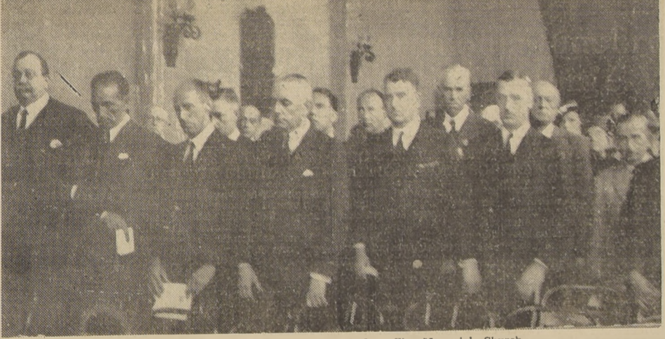
Durante el funeral en el Saint Andrew War Memorial Church.