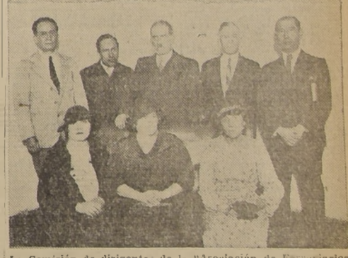
La Comisión de dirigentes de la "Asociación de Ferroviarios Jubilados", que expresa su gratitud por el Excmo. señor Alessandri.