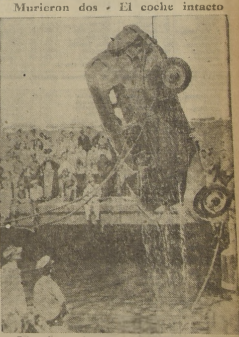
Fotografía tomada en el momento en que una dotación de bomberos norteamericanos extrae del fondo del río, el un puerto de Los Angeles, un automóvil Chevrolet que precipitara a las aguas. Sus ocupantes, un matrimonio de sesenta años, perecieron ahogados en el accidente, mientras que el coche fue rescatado intacto.