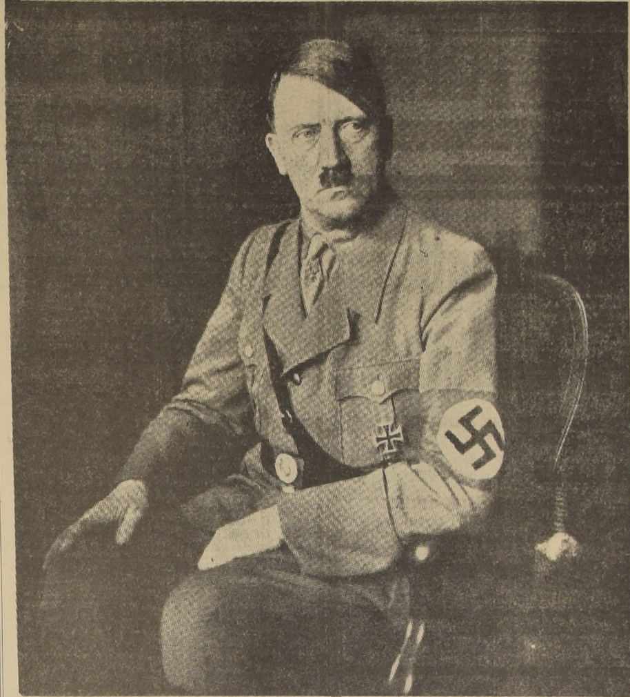
FÜHRER DE ALEMANIA. ADOLF HITLER, PRESIDENTE Y CANCELLER DEL REICH, QUE CELEBRA HOY EL TERCER ANIVERSARIO DEL ADVENIMIENTO DEL NACIONAL-SOCIALISMO AL PODER.

Alemania así está importando gran parte de sus materias primas del imperio británico, a pesar de que éste cada día pone más obstáculos a la compra de sus productos industriales mediante tarifas proteccionistas. Alemania es un país casi sin flota de guerra y sin dinero que no puede posiblemente ser sospechada de tener ambiciones imperialistas. ¿No resulta de todo eso forzadamente una comunidad de intereses que descanse en las mutuas ventajas entre los países Ibero-americanos, ricos en materias primas y hambrientos por productos industriales y la Alemania pobre de materias primas e industrialmente poderosa? ¿Puede imaginarse una inteligencia más feliz que la que debe existir en este caso? ¿Hay mejor seguridad por la paz política y económica que este intercambio mutuamente satisfactorio?