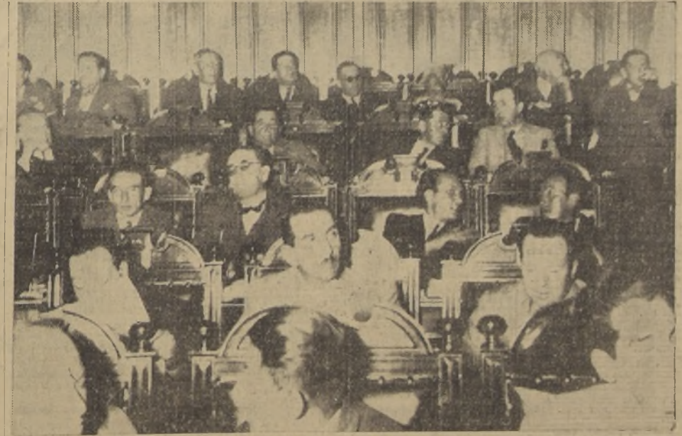
Un aspecto de la Cámara durante la sesión de anoche