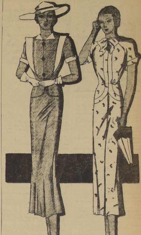
Sobre este traje de piqué. Modelito juvenil en tela estampada con anchos biesses...