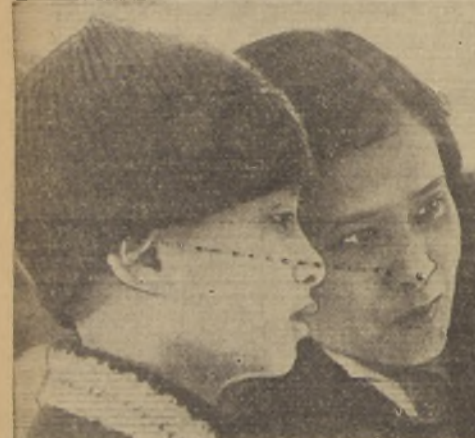
El Rey Ananda Mahidol, nacido en 1924, Monarca de Siam, se ve aquí en compañía de su madre, la Princesa Sangwall Mahidol, presenciando los deportes invernales en Mergins, Suiza, en donde están pasando unas vacaciones. El joven Rey sucedió a su tío, el Rey Prajadhipok, cuando éste abdicó en marzo 2 de 1935. Ananda probó los deportes de hockey y ski, y decidió que le gustaban ambos.