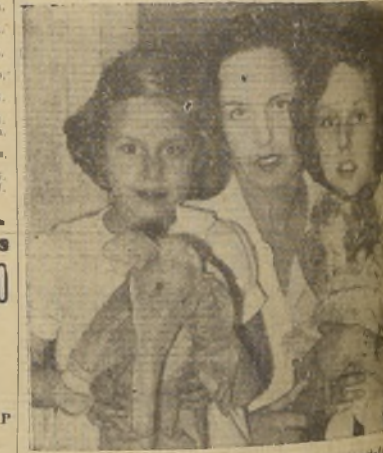
Mme. Arlette Stavinski, viuda del notorio estafador, quien fue exonerada de toda culpa en París por acusación que se le hacía de complicidad en la fuga de su marido que ascendieron a $ 10.000.000 por vez en muchos meses sonrió al leer el veredicto. Fue acompañada de sus hijitas en su hogar de París.