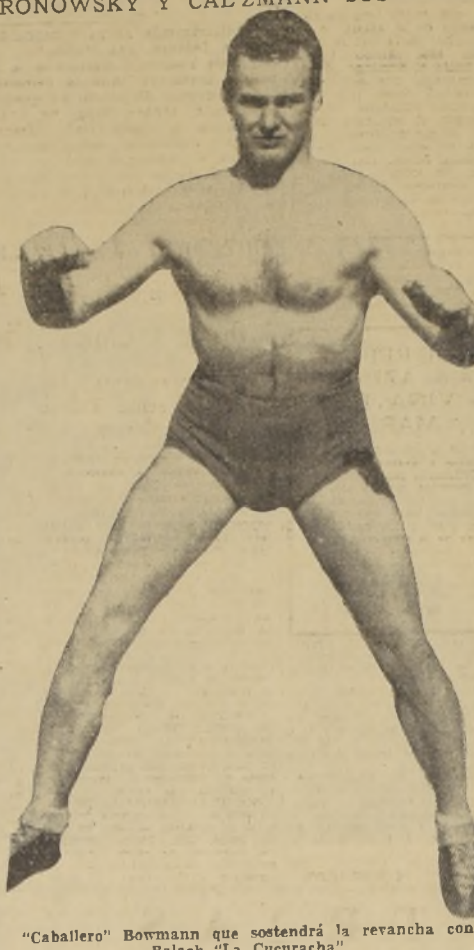
"Caballero" Bowman que sostendrá la revancha con Balach "La Cucaracha"