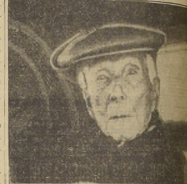
John D. Rockefeller (padre) el multimillonario "Petróleo", quien pasa su temporada anual de invierno en Daytona Beach, Estado Florida, permitió que se tomara esta fotografía durante un paseo en automóvil. El Sr. fue felicitado por el señor Rockefeller, quien cuenta 90 años de edad.