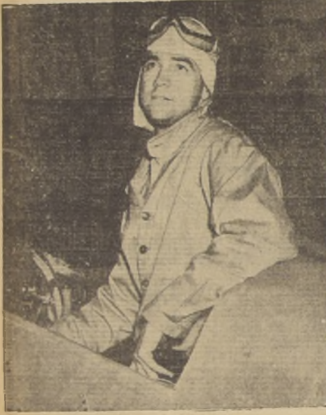
Howard Hughes, productor cinematográfico, quien hizo un vuelo sin escalas a través de los Estados Unidos, desde Los Angeles a Nueva York, recorriendo 2.450 millas en 9 horas y 43 minutos. Se asegura que éste es un nuevo "record" de velocidad en vuelo largo sin escalas.