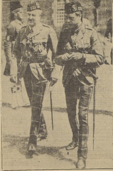
He aquí una interesante fotografía del Principe de Gales, ahora Eduardo VIII de Inglaterra, tomada en momentos en que llegaba, en su capacidad de coronel en jefe, al Real Colegio Militar Duque de York, en Dover, Kent, para presentar las banderas al segundo batallón de los "Seaforth Highlanders".