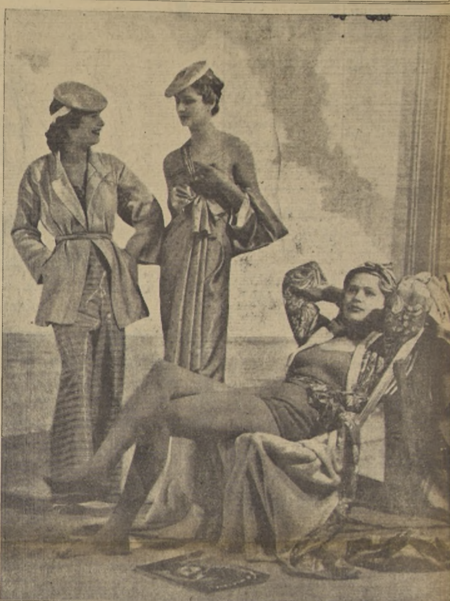
Trajes de playa de "chintz glacé", de Schiaparelli