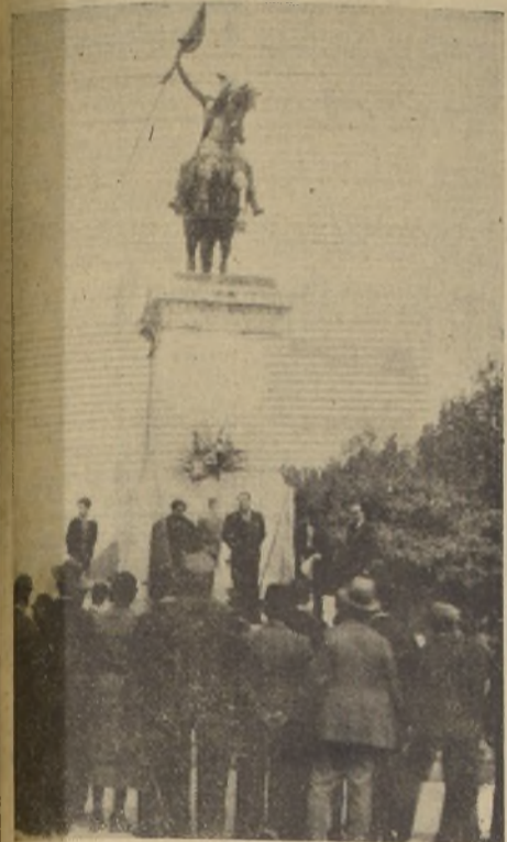
DURANTE LA CEREMONIA AL PIE DE LA ESTATUA DE SAN MARTIN

El Círculo Patriótico realizó ayer diversos actos conmemorativos del 12 de Febrero