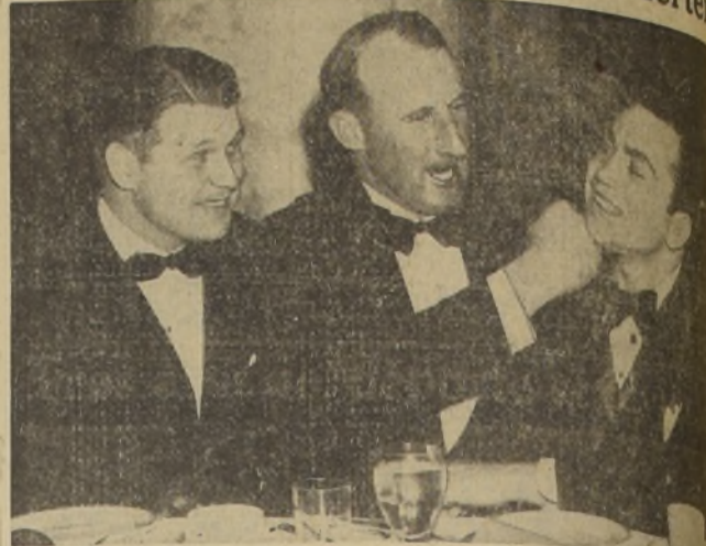
Jimmy Fox, famoso jugador basebolero de la novena "Red Sox" de Boston (a la izquierda), veterano jugador de los "Tigres" de Detroit (centro), y campeón mundial de boxeo de la división "welter", se ven aquí en una instantánea durante el banquete de la Asociación de Escritores de Deportes de Nueva York. En esta ocasión se le presentó a Goslin un trofeo por haber conquistado el "hit" que le dio el campeonato de Detroit.