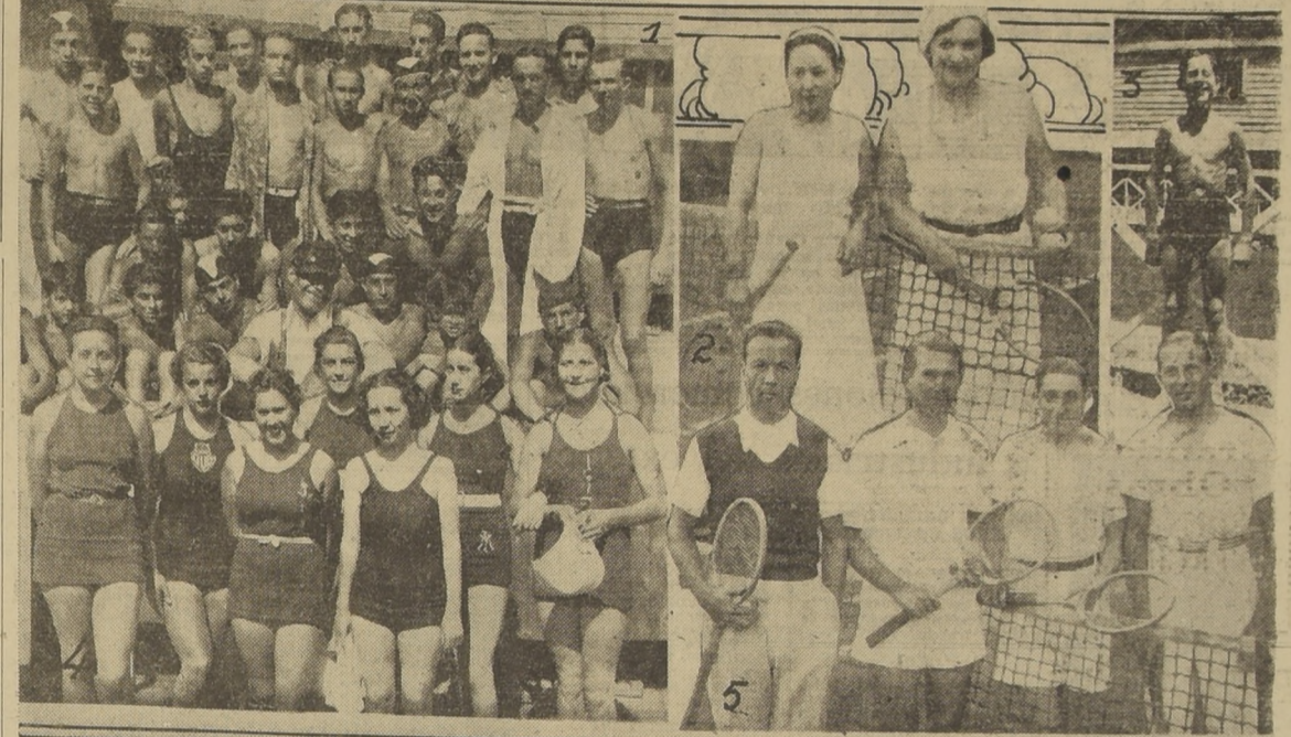
Damos algunos aspectos de los últimos torneos efectuados en Concepción. 1 y 4 Nadadores y damas que actuaron en uno de los últimos campeonatos.