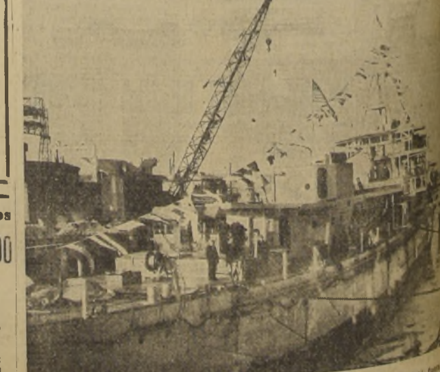
He aquí el "Erie", el primero de un nuevo tipo de canoneros que está fuera de las limitaciones de todos los tratados navales, y el cual fue botado al agua en las instalaciones de todos los tratados navales, y el cual fue botado al agua en las instalaciones de todos los tratados navales, y el cual fue botado al agua en las instalaciones de todos los tratados navales. Mide 382 pies y medio de largo.