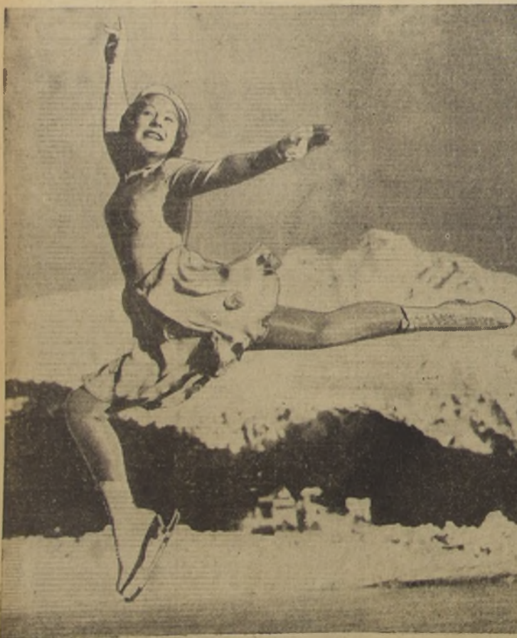
Sonia Henie, la famosa y bella noruega reina de las patinadoras y campeona mundial de bailes en patines, quien por la novena vez consecutiva conquistó el campeonato europeo para mujeres patinadoras en el "Sport Palast" en Berlín. Los más renombrados patineros estuvieron de acuerdo en que ella continúa siendo una maravilla tanto como bailarina, como acróbata en patines de hielo. Ella espera retirarse después de los olimpiadas de esta temporada.