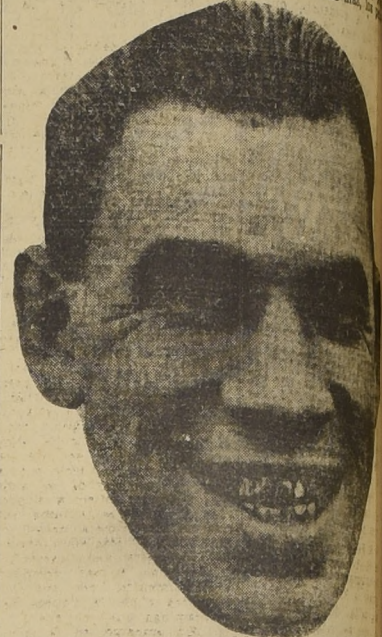
El fuerte y valiente vasco Uzcudúm

do que no saqué nada! Pero ten la seguridad de que si no pararan tan prematuramente la pelea, Louis hubiera tenido que sudar mucho para asegurar la victoria. ¡No me hubiera vuelto a dejar coger "asando mateca"!