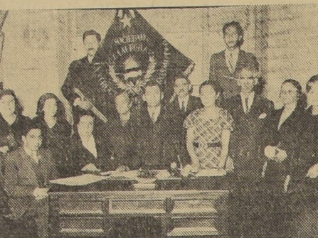
El nuevo directorio de la Sociedad Mutual La Aurora, en el momento de asumir ayer sus funciones...