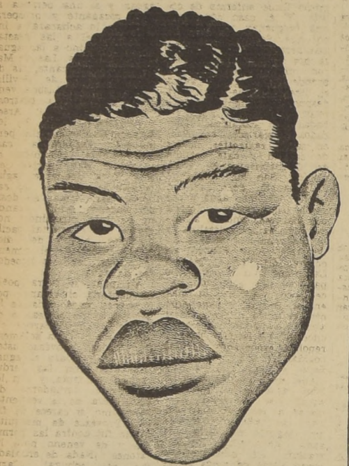
Joe Louis, a quién su hermano de raza, Jack Johnson, le desconoce su habilidad técnica en el deporte que lo ha hecho famoso en cortos meses

equilibrar cuando golpea. Todavía no se ha enfrentado con un contrario que sepa sacarle partido a esa debilidad. Todos sus contrarios le han tenido miedo... terror pánico.