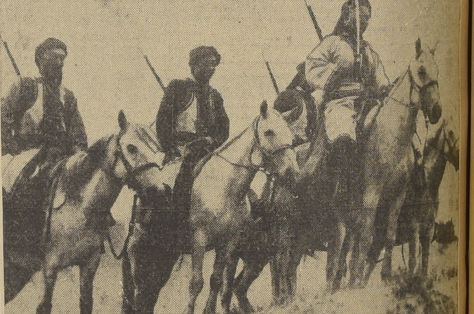
Despachos precedentes de Urga, Mongolia, informan que han habido choques en la frontera entre destacamentos mongoles y manchukouenses.