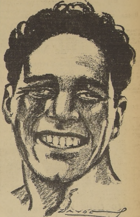
Arturo Godoy. Se ha fijado en forma definitiva el match entre Arturo Godoy y José Caratoli...