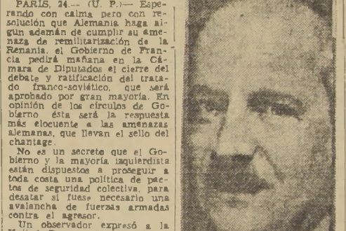
M. Flandin, quien defendió el pacto franco-ruso ante el Parlamento