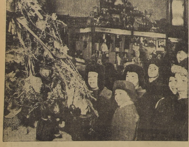
Por primera vez desde la revolución comunista, los rusos celebraron con enorme alegría las festividades del Año Nuevo.