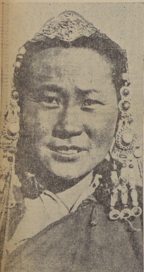
Belleza mongol, símbolo femenino de la tierra que se disputan rusos y japoneses, y que cada día amenaza ser el origen de una conflagración. Esta bella de los ojos oblicuos lleva veinte libras en oro en su cabeza.