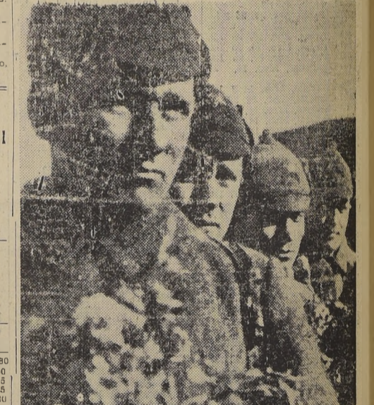
Estos soldados de la guardia soviética de fronteras han sido recibidos como héroes a su vuelta a Khabarovsk, después de haber sostenido un rudo encuentro con las tropas manchukano-japonesas en la región en disputa.