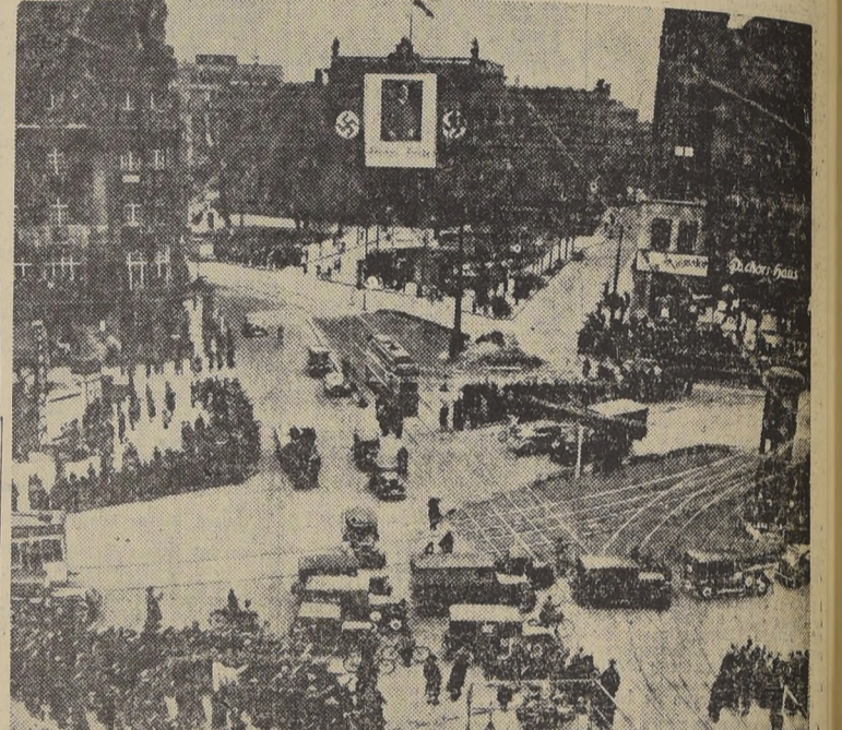
A las 16 horas del día 27 de marzo, podían oírse sirenas resonar en toda Alemania para anunciar que todo tránsito de vehículos debía ser suspendido durante un minuto mientras Hitler dirigía una arenga relacionada con las elecciones. Aquí se ve la Plaza de Potsdam, en Berlín, en el momento en que están detenidos todos los vehículos, mientras la concurrencia hace el saludo nazi.