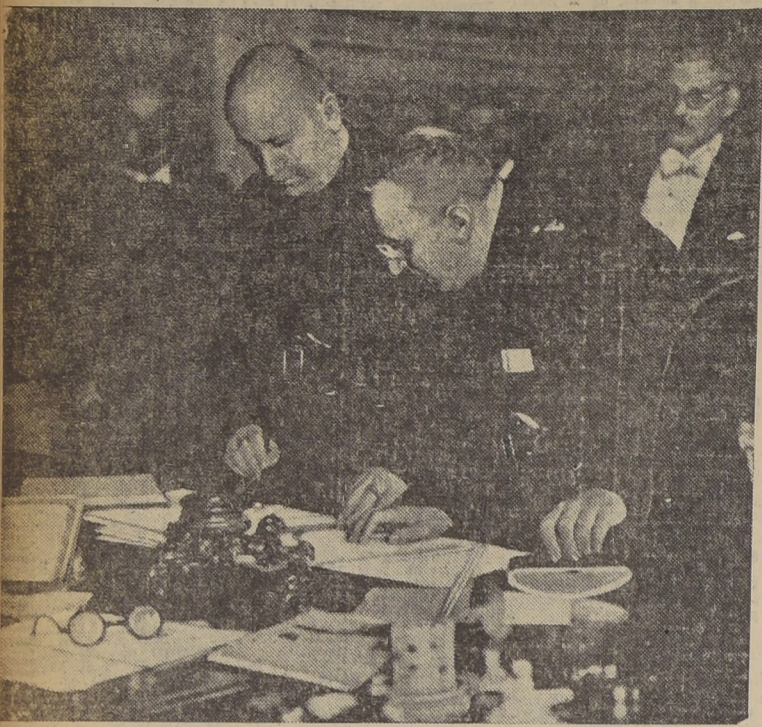
El señor Mussolini, en el momento de suscribir los protocolos por los cuales se constituyó el bloque italo-austro-húngaro. Detrás del Duce se advierten los señores Goemboes y Schachnig.