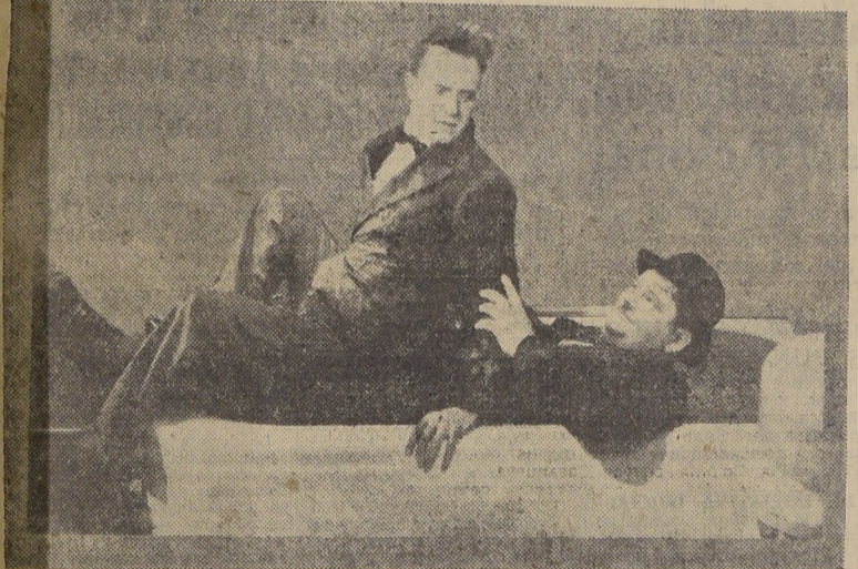
El Gordo y el Flaco, en su gracioso castellano, saludarán al público de Santiago, el día de la inauguración del Teatro Metro.

Laurel y Hardy hablarán al público de Stgo.