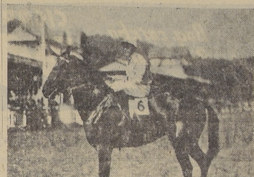
En invicto Darien, favorito de la cátedra. — En Nagana y Limoges, lleva el Isabelino, sus enemigos principales. — Si Agilidad responde a sus aportes, puede encargarse de la sorpresa...