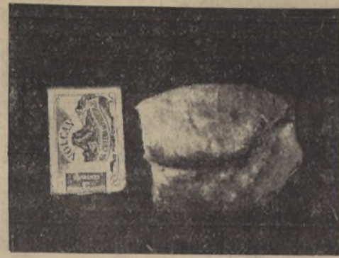
Un poco más grande que una caja de fósforos, este pan que se vende a veinte centavos las tres unidades

En la tarde de ayer, la Junta de Exportación Agrícola nos entregó la siguiente declaración: