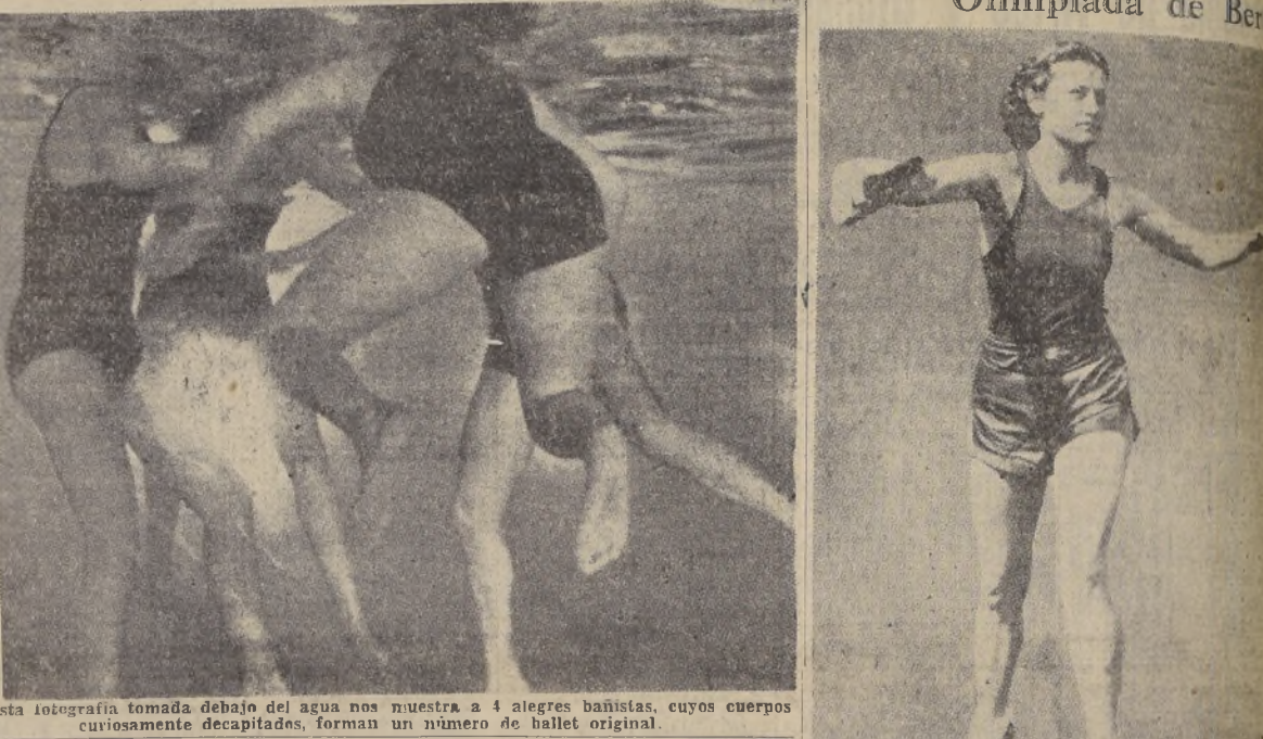
Esta fotografía tomada debajo del agua nos muestra a 4 alegres bañistas, cuyos cuerpos curiosamente decapitados, forman un número de ballet original.