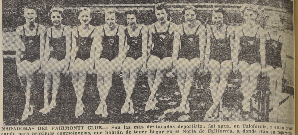
NADADORAS DEL FAIRMONT CLUB. - Son las más destacadas deportistas del agua, en Calofornia, y están practicando para próximas competencias, que habrán de tener lugar en el Norte de California, a donde irán en representación de su club.

PARIS 25 (U. P.) - El dólar abrió hoy en esta plaza a 1519 francos, y la libra esterlina, a 75.64 francos.