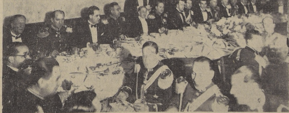
El Ministro de Defensa Nacional, el Ministro del Interior y altos Jefes del Ejército y el presidente de la Corte Suprema durante la comida de aniversario en el Tacna