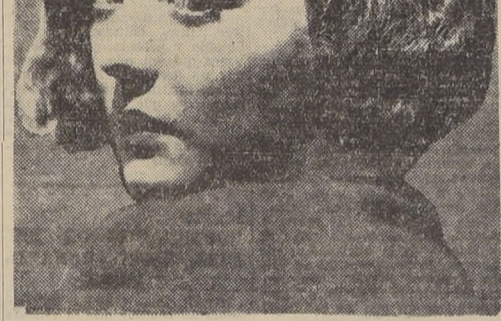
Sylvia Sidney, que protagoniza el drama policial "Amor y Crimen", que se da a conocer hoy en la pantalla del Santiago

Como obra de selección, dentro del género policial, surge ahora una película de aventuras dramáticas que, de seguro, será un suceso: "Amor y Crimen" a cargo de Sylvia Sidney y de un valioso grupo de artistas de la Paramount.