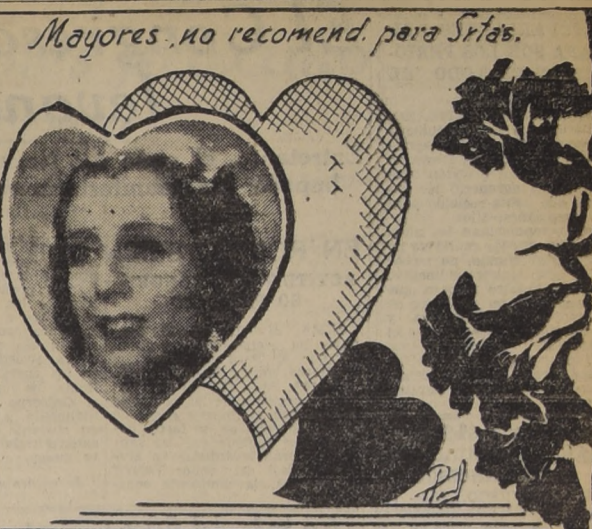
Mayores, no recomend. para Srías.

DEBUT MAÑANA A LAS 8.45 P. M. PRESENTACION EXTRAORDINARIA. PLATA: $ 15; P. ALTA, $ 10; BALCON, $ 8; ANFITHEATRO, $ 5; GALERIA, $ 3. Localidades en venta, desde las 10 A. M. TELEF. 84407.