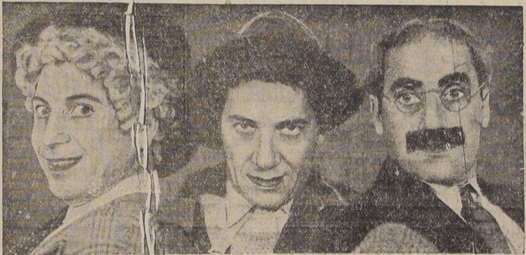
Chico, Groucho y Harpo, los tres famosos hermanos Marx...