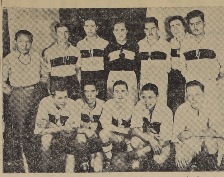
Primer cuadro del Internado Nacional Barros Arana, clasificado campeón escolar de apertura del presente año...