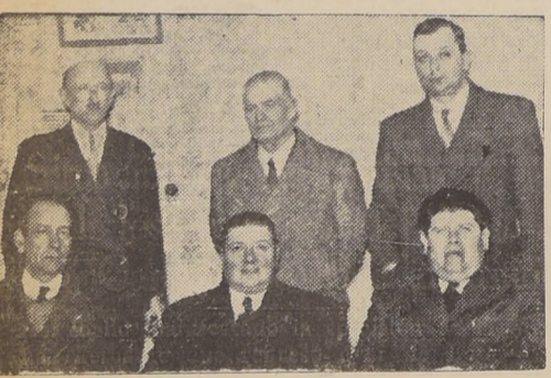
Comisión de la Confederación de Sindicatos de la Marina Mercante que fue a Lota para investigar la pérdida del "Don Carlos".

Así lo ha manifestado la comisión de la Marina Mercante que regresó ayer de Lota.— Se activan los trabajos para la colecta en favor de los damnificados