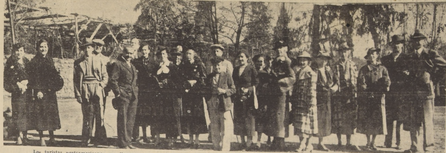
Los turistas norteamericanos que llegaron ayer en el Douglas "Santa Ana", después de un almuerzo que se les ofreció en una quinta de los alrededores