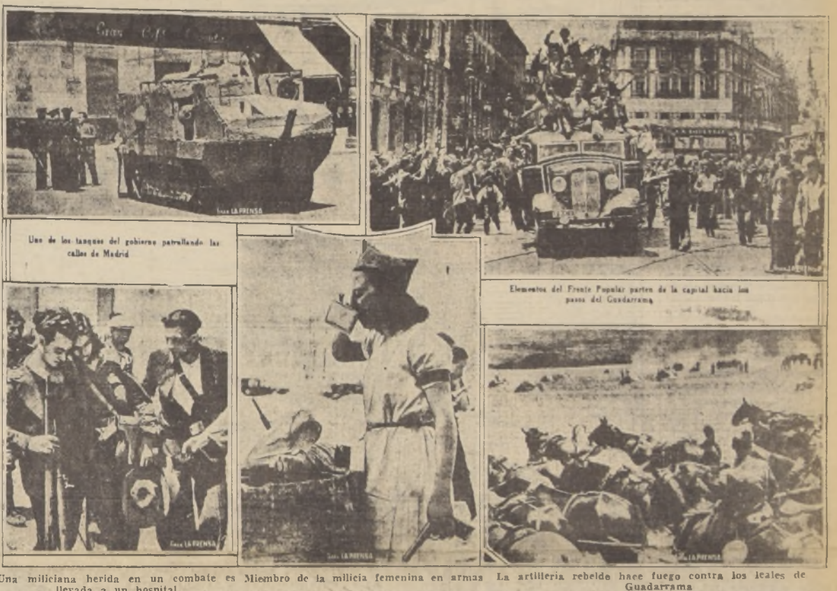
Una miliciiana herida en un combate es miembro de la milicia femenina en armas. La artillería rebelde hace fuego contra los leales de Guadarrama.