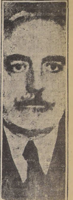
GENERAL FANJUL, QUE FUE EJECUTADO AYER EN MADRID

BURGOS, 17.—(U. P.)— Las tropas del Gobierno no cesan en su desesperado esfuerzo de avanzar a lo largo del frente de Norte, tratando de romper las líneas rebeldes antes que los legionarios extranjeros y las tropas de Marruecos, que han sido enviadas aquí por el general Franco, tomen posiciones.