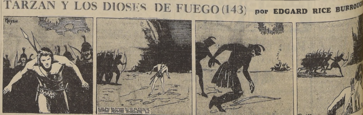
TARZAN Y LOS DIOS DE FUEGO (143) por EDGAR RICE BURROUGHS

Sept. 1. 6.50 Sept. 2. 6.40 Sept. 3. 6.30 Sept. 4. 6.20 Sept. 5. 6.10