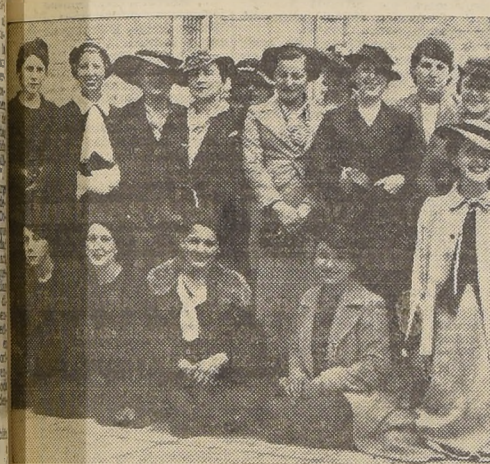
Las alumnas del Liceo de Talca durante su visita a "LA NACION"