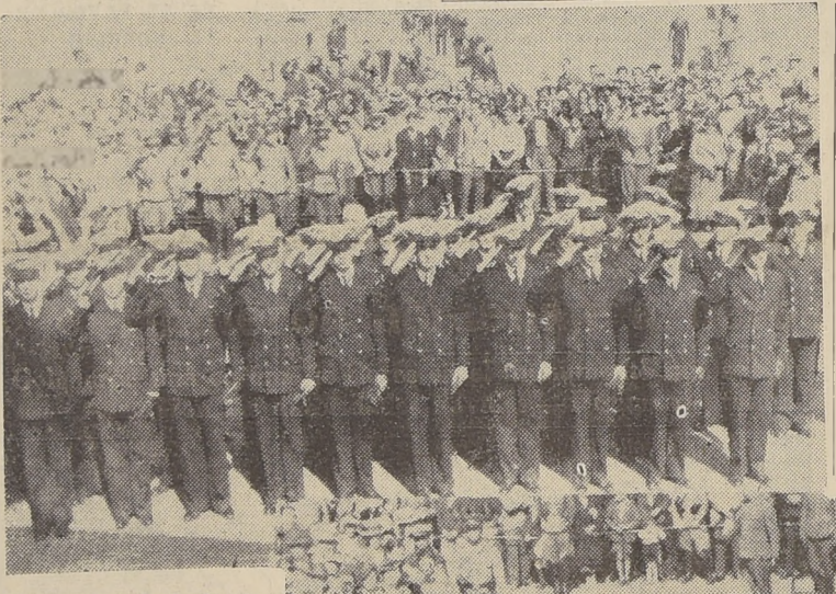
Los marinos de la fragata-escuela argentina "Sarmiento", rindieron ayer un homenaje a los héroes de nuestra Marina nacional, capitán Prat y sus compañeros que cayeron en el Combate Naval de Iquique.

Colocaron una corona de flores en el monumento que se alza en la Plaza Sotomayor. — Asistieron las autoridades navales. — Discursos pronunciados en esta ceremonia