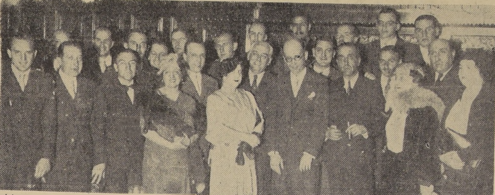
Asistentes al cocktail ofrecido ayer en el Crillon por la delegación de estudiantes argentinos, en retribución de las atenciones recibidas durante su visita a Santiago