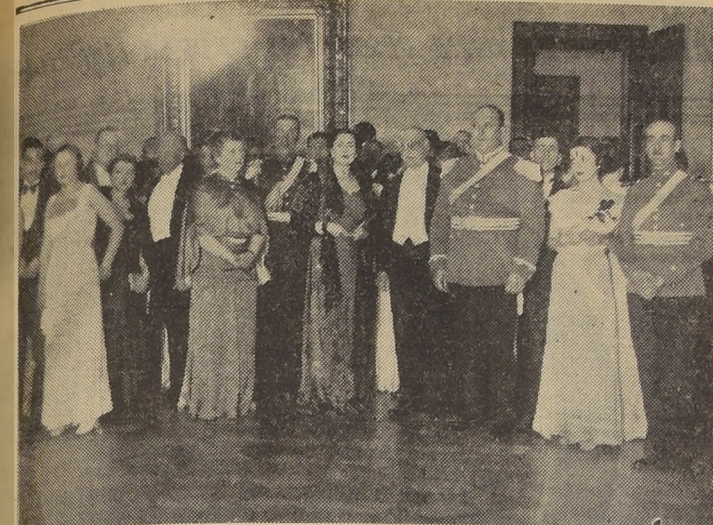
Los aspectos de la brillante recepción ofrecida por el Alcalde de Valparaíso en la Municipalidad de ese puerto. En el primero de ellos aparecen el Director General de la Armada, vicealmirante