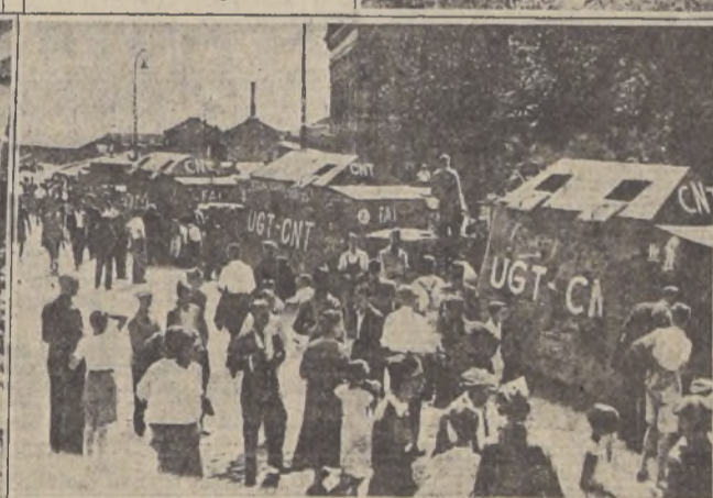
Carros blindados llegan a Madrid procedentes de Cataluña