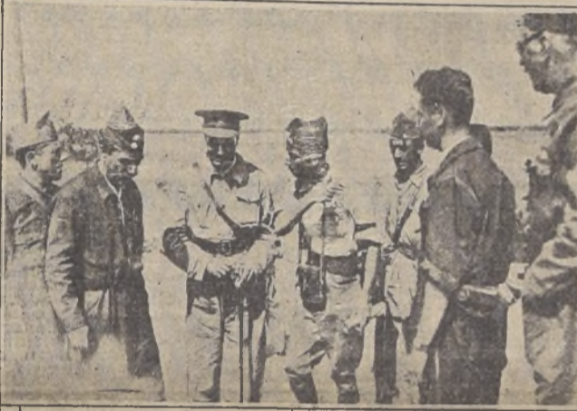
El general Azaña recibe noticias de la marcha de las operaciones