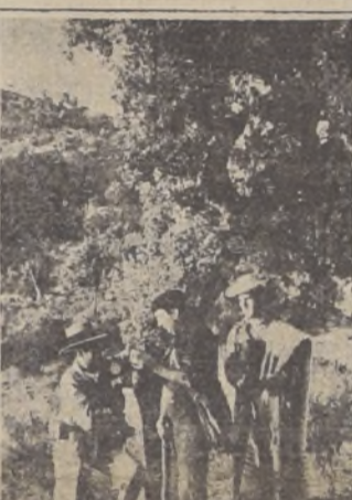
El jefe de la columna de milicianos de Villanueva de Córdoba imparte instrucciones a su gente