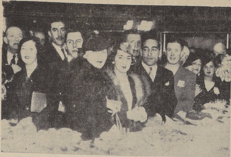
Parte de los asistentes a la reunión social a que dió lugar ayer la inauguración del Hotel Ritz