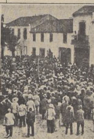
Los vecinos de Alcanáez se presentan a la comandancia militar para alistarse