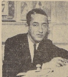
Dr. RENATO VALENZUELA, comentarista del Panorama Cinematográfico.

Las interesantes audiciones cinematográficas que presenta el conocido comentarista Renato Valenzuela, continuarán diariamente, excepto domingos, de 5 a 6 de la tarde por Radio del Pacífico de Santiago.