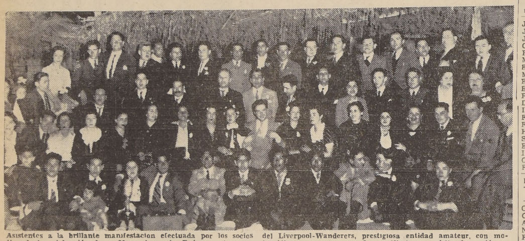
Asistentes a la brillante manifestación efectuada por los socios del Liverpool-Wanderers, prestigiosa entidad amateur, con motivo de la celebración de su 29.º aniversario.