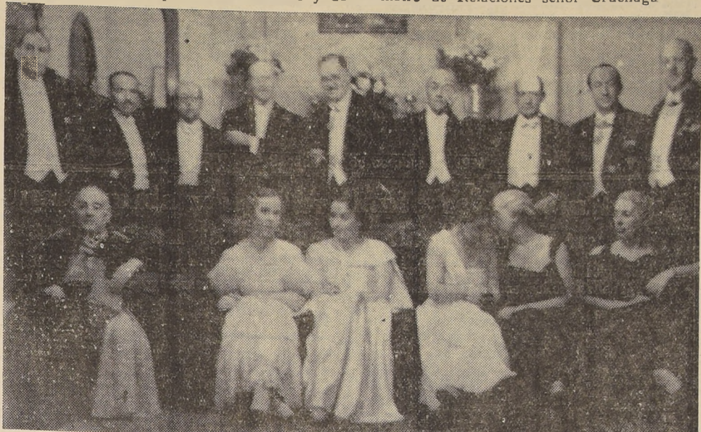
Distinguidas personalidades de la diplomacia y nuestra sociedad durante la recepción en la Legación de Rumania.