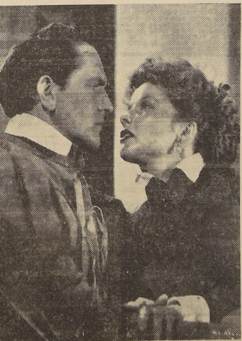
Katharine Hepburn y Fredric March, astros de R. K. O., protagonistas de "Maria Estuardo, Reina de Escocia", interesante producción cuya premiere ofreció anoche el Central, y que hoy estrena en ambas funciones.