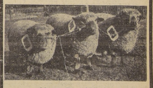
presentará a la 66.ª Exposición Anual de Animales, organizada por la