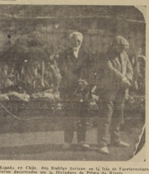
Unamuno y el Embajador de España en Chile, don Rodrigo Soriano, en la Isla de Fuerteventura, donde ambos estuvieron desterrados por la Dictadura de Primo de Rivera.

Ilustre escritor y diplomático español, ha hecho la siguiente crítica de Unamuno: "Unamuno es la primera figura literaria de España que podrá ganarse en variedad de experiencia; en arte de escritor, en arte de filósofo, en arte de crítico, en arte de periodista, en arte de hombre de mundo, en arte de hombre de letras, en arte de hombre de acción. Unamuno es un hombre que ha vivido en todas las épocas de la vida de España, desde la Restauración hasta la actualidad. Su obra es una síntesis de todas las corrientes literarias y filosóficas de su tiempo."