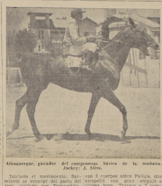
Albuquerque, ganador del compromiso básico de la mañana. Jockey: J. Silva.