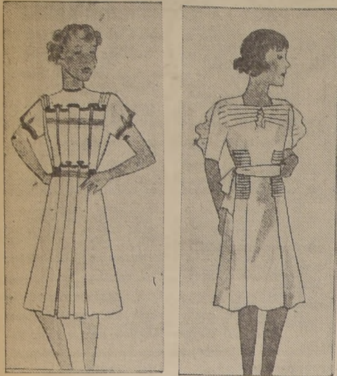
BILLIQUE DECREE.— Vestido de "crepe de chine" lavanda y satén azul marino; vueltas violetas.