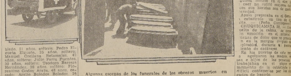
Algunas escenas de los funerales de los obreros muertos en Chuquicamata