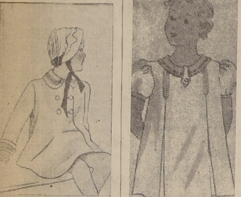
BILLIQUE DECREE.— Vestido de marocain azul claro.